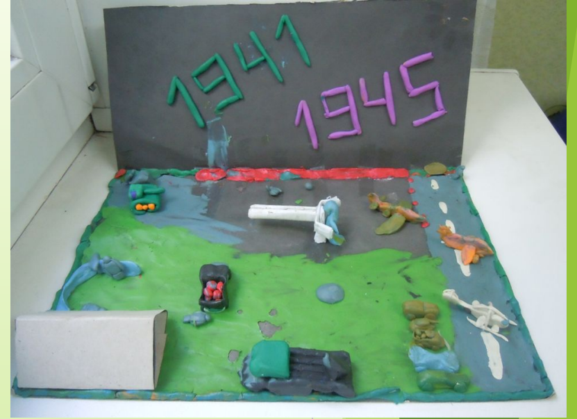
«На поле боя»