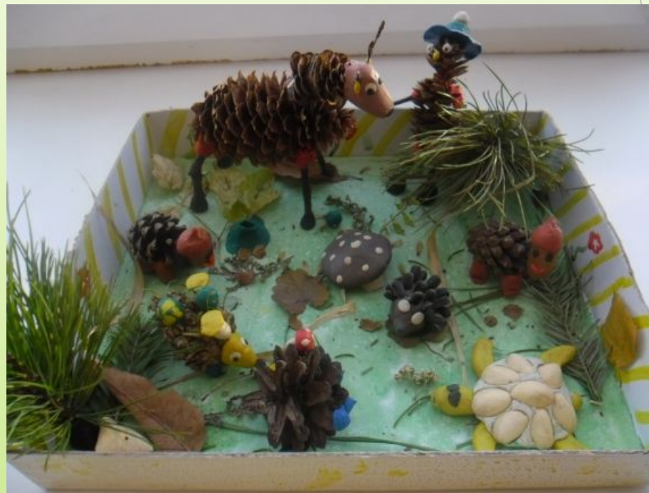
«В сказочном лесу»