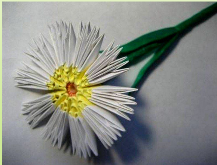
«Цветок в подарок»