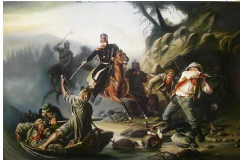
«Стычка с финляндскими контрабандистами» В. Худяков