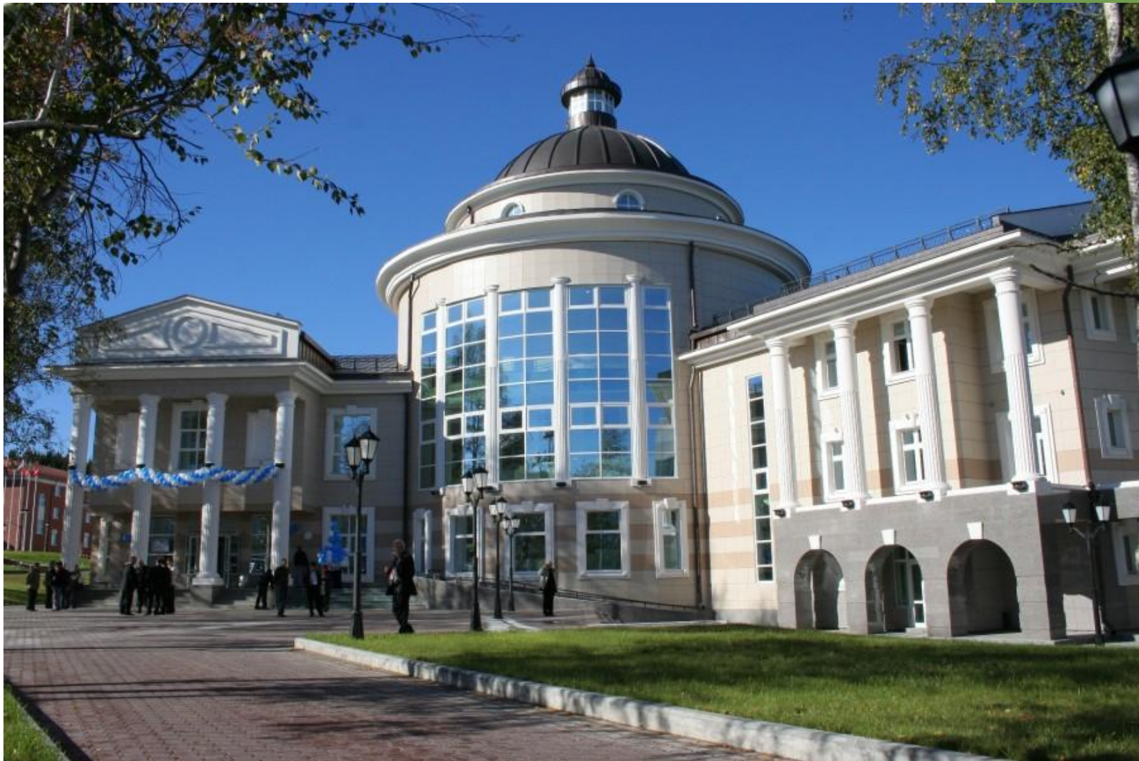
Государственная окружная художественная галерея г. Ханты-Мансийск