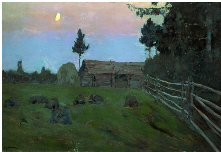
«Сумерки» И. Левитан