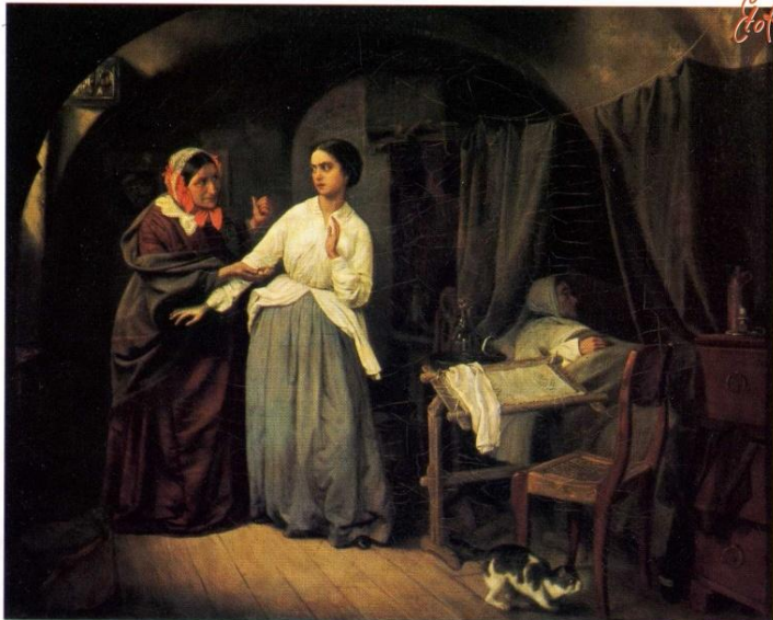
«Искушение» Н. Шильдер