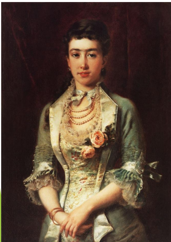
«Портрет свояченицы» К. Маковский

В государственной окружной художественной галерее представлены следующие шедевры художников-передвижников.