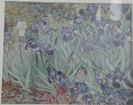
ВИНСЕНТ ВАН ГОГ «ИРИСЫ»