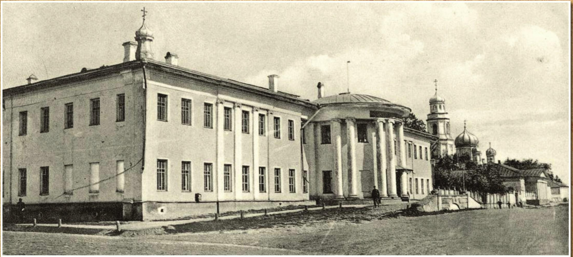
ЕКАТЕРИННСКИЙ УЧИТЕЛЬСКИЙ ИНСТИТУТ

В 1881 году при мужской гимназии Нарышкин открыл общежитие для малоимущих гимназистов, было выделено 100 000 рублей на его содержание. Наиболее ярким и талантливыми ученикам платили стипендию из средств Нарышкина.