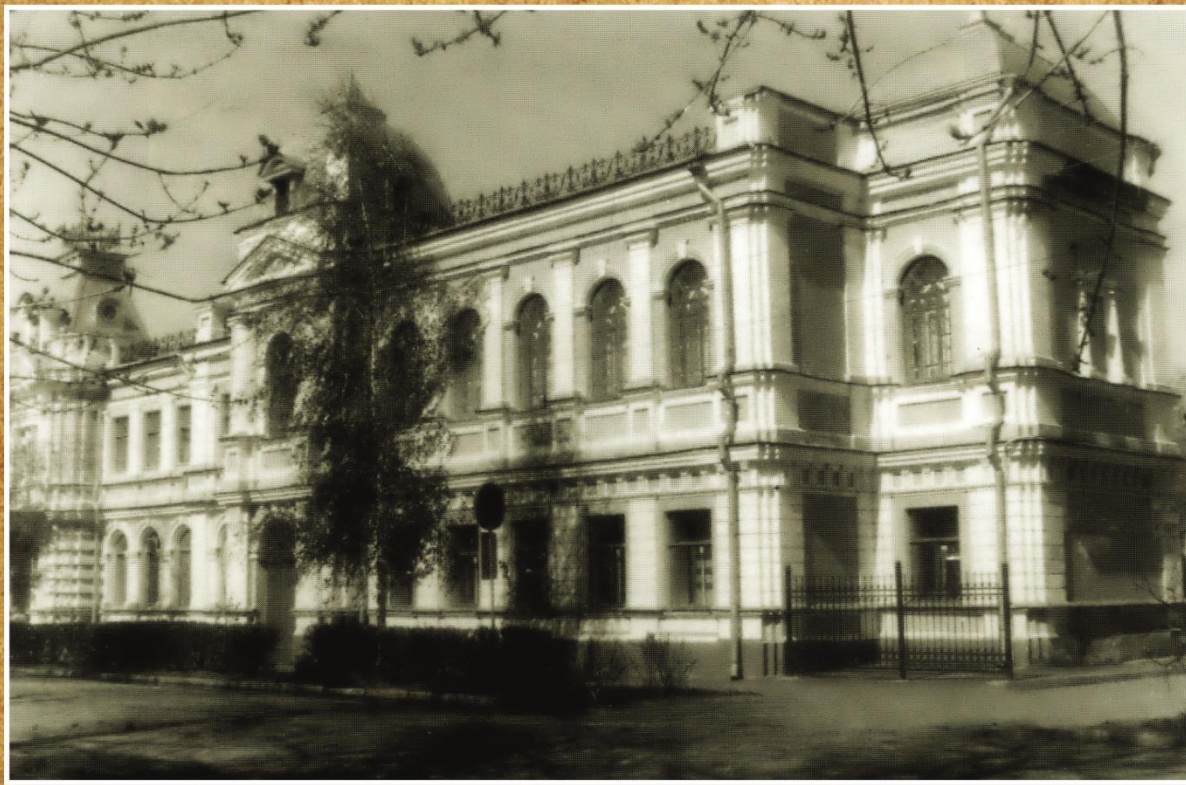
ШКОЛА ДЛЯ СЛЕПЫХ ДЕТЕЙ