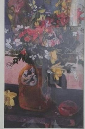
ПОЛЬ ГОГЕН «НАТЮРМОРТ С ЦВЕТАМИ»