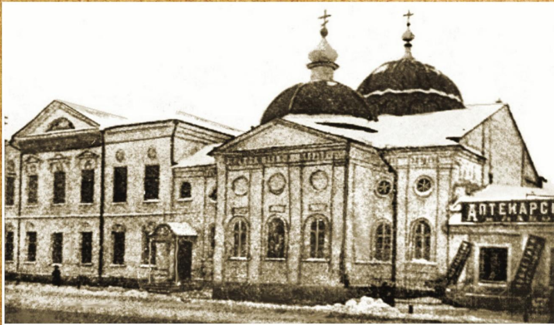
ТАМБОВСКАЯ ГОРОДСКАЯ БОГАДЕЛЬНЯ

Носовская богадельня в начале 20 века содержала около 800 человек. При ней был приют для детей