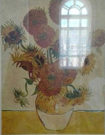
ВИНСЕНТ ВАН ГОГ «ВАЗА С ПЯТНАДЦАТЬЮ ПОДСОЛНУХАМИ»