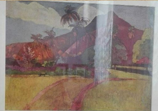
ПОЛЬ ГОГЕН «ТАИТЯНСКИЙ ПЕЙЗАЖ»