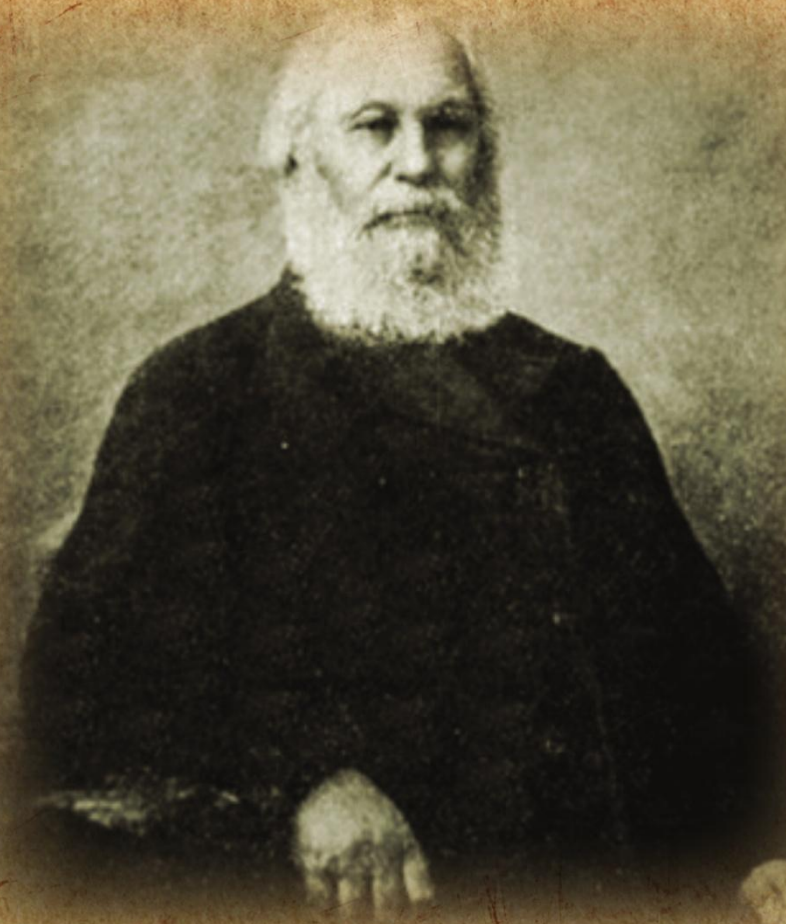
АНДРЕЙ МИХАЙЛОВИЧ НОСОВ

Это также представители известной дворянской фамилии, которые прославились как меценаты. Наиболее известный из них — Андрей Михайлович (1814-1897). Он разбогател на торговле скотом, приобрел большие земельные территории в Борисоглебском уезде. Он был известный филантроп и пожертвовал на благотворительные нужды города 4,5 млн. рублей. В 1869 году он учредил Тамбовскую городскую богадельню, для которой были построены 4 каменных корпуса. Он же открыл приюты для странников, больных и детей. На средства А.Н.Носова были открыты также ночлежный дом и бесплатная лечебница, ремесленное училище.