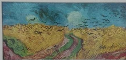
ВИНСЕНТ ВАН ГОГ «ПШЕНИЧНОЕ ПОЛЕ С ВОРОНАМИ»