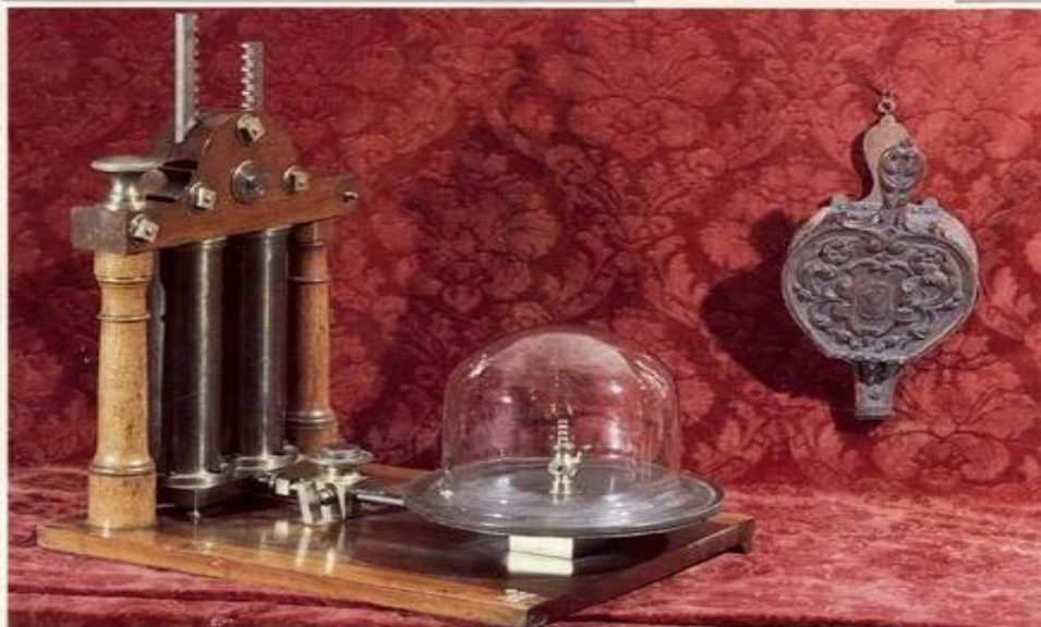
Воздушный насос XVIII в. Музей М.В.Ломоносова, Ленинград

Ломоносов считал химию своей «главной профессией», причем развитие химии, по мнению ученого, должно было помочь решению практических задач. «Истинный химик должен быть теоретиком и практиком», – писал он. Став профессором химии, Ломоносов начал добиваться создания химической лаборатории.