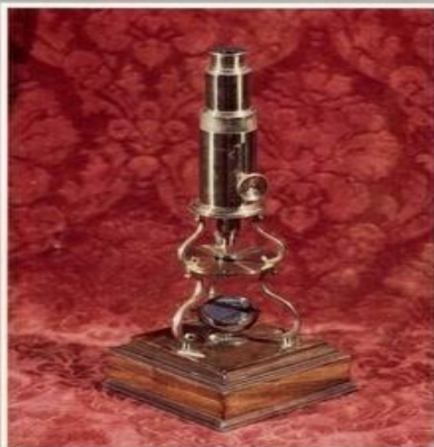
Микроскоп XVIII в. Музей М.В.Ломоносова, Ленинград