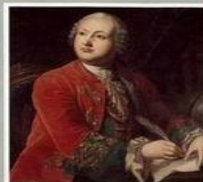
М.В.Ломоносов. Неизвестный художник XVIII в. Архангельская областная краеведческая музей

Ломоносов считал химию своей «главной профессией», причем развитие химии, по мнению ученого, должно было помочь решению практических задач. «Истинный химик должен быть теоретиком и практиком», – писал он. Став профессором химии, Ломоносов начал добиваться создания химической лаборатории.