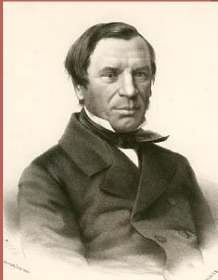
М. П. Погодин

До 14 лет Фет жил и учился дома, а затем в городе Верро (Лифляндский губернии), в пансионе Кроммера. В 1837 г. его перевезли в Москву и поместили у М. П. Погодина; вскоре за тем Афанасий Афанасьевич поступил в Московский университет, на историко-филологический факультет. Почти все студенческое время Фет прожил в семье своего товарища по университету, будущего литературного критика Аполлона Григорьева, имевшего влияние на