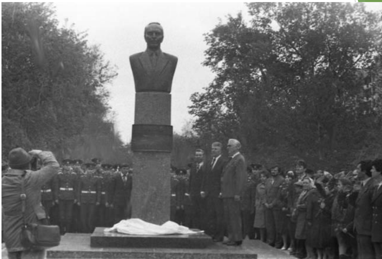
Открытие памятника Н.Н. Семенову в Саратове автор И. Козловский (май 1981 г.)