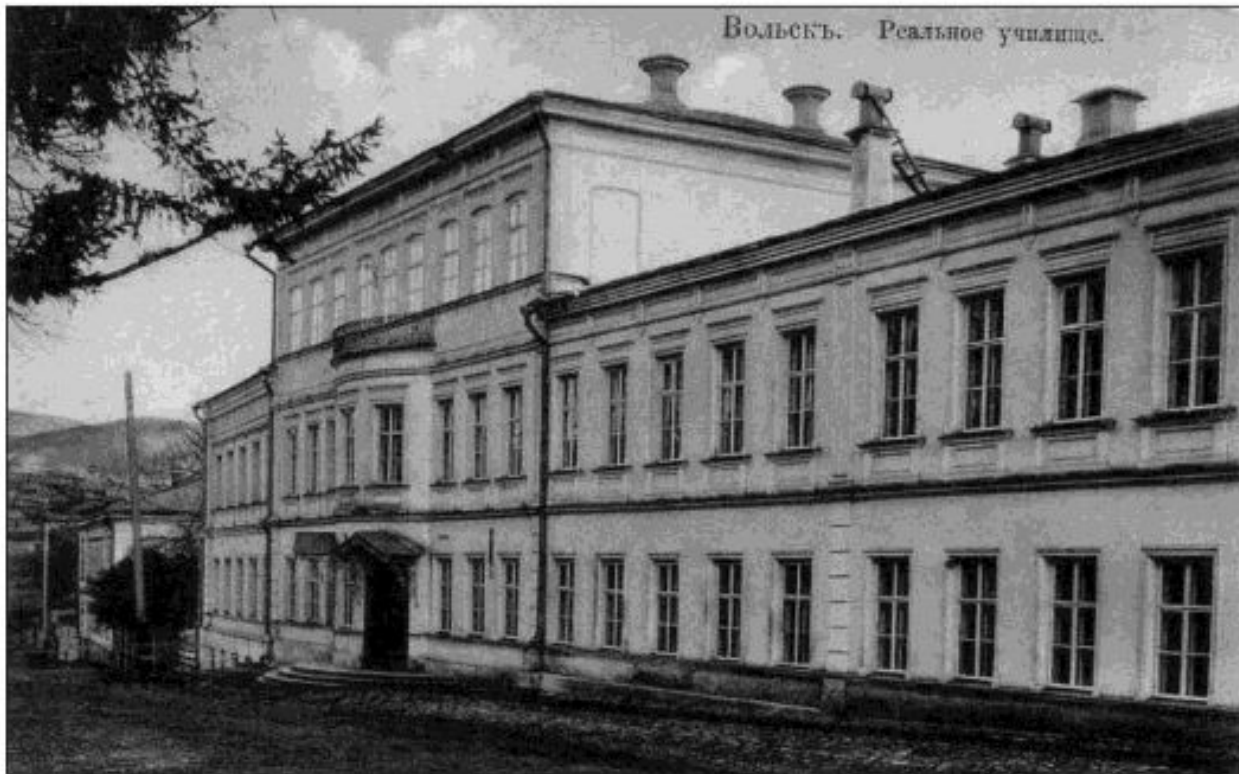
Вольское реальное училище. Начало 20 века.