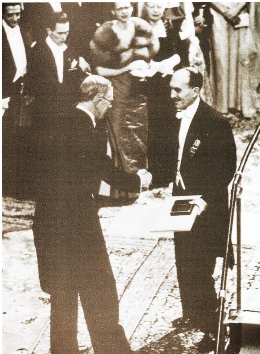
Вручение Нобелевской премии