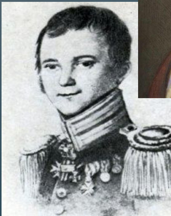
• Ф. Глинка Бестужев

В 1823 г. Алябьев, в чине подполковника, вышел в отставку с мундиром и полным пансионом. Среди его друзей – будущие декабристы А. Бестужев и Ф. Глинка, А. С. Грибоедов, поэт-партизан Денис Давыдов.