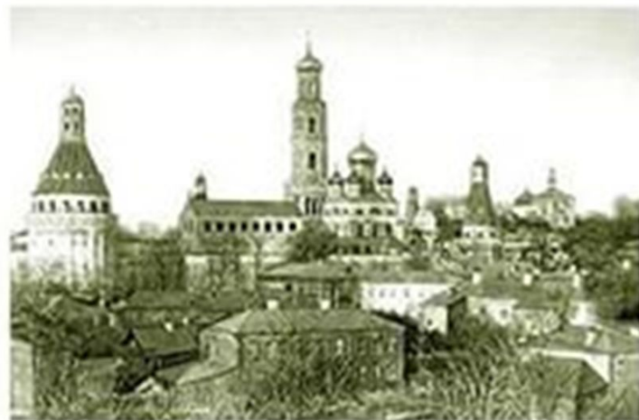
Александр Алябьев был похоронен в 1852 г. Симоновом монастыре