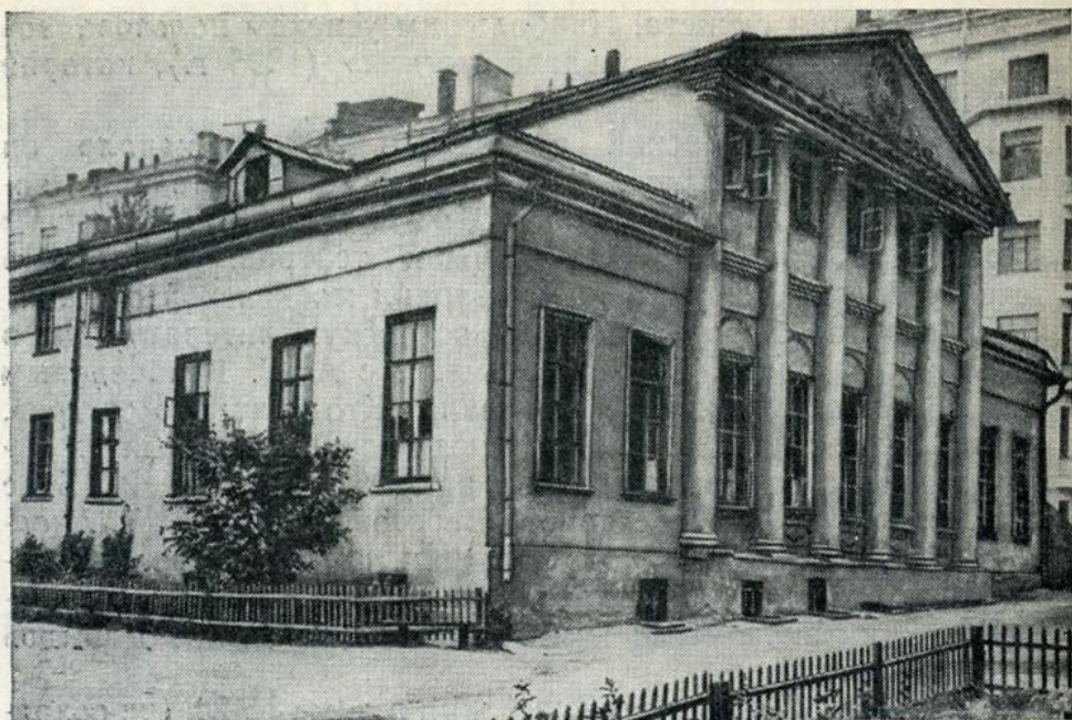
Новинский бульвар (улица Чайковского), 7. В этом доме прошли последние годы А. А. Алябьева.

Великий композитор умер 6 марта 1851 года в Москве, так и не добившись восстановления в правах.