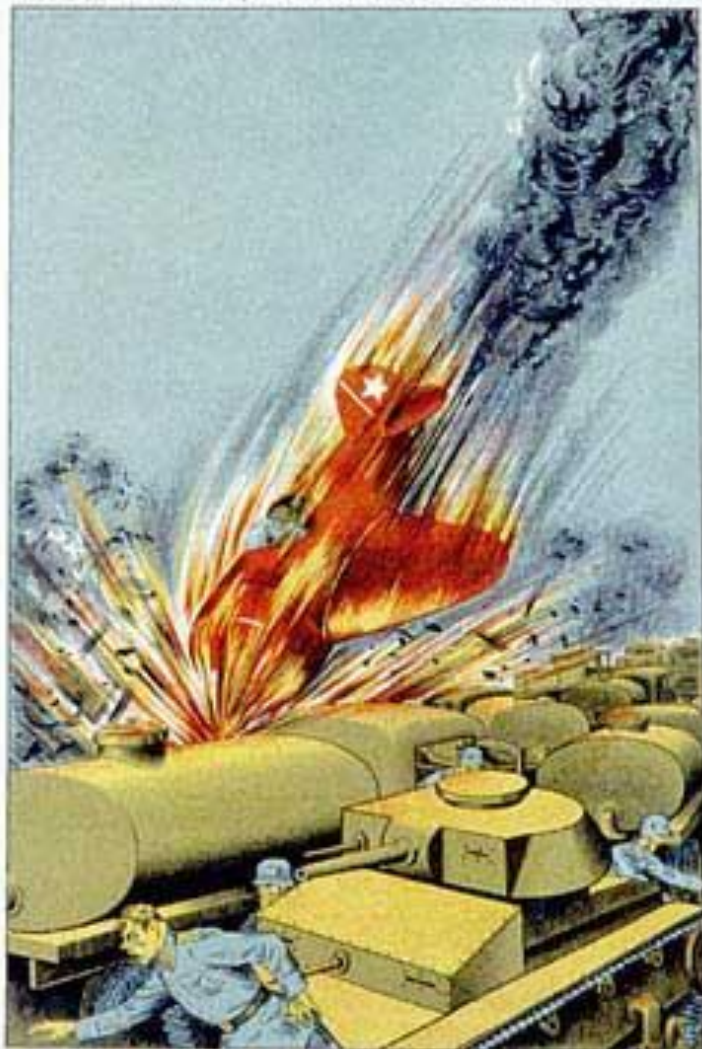
Слетая в одиночку прямо в цель в Ленинградском небе Герой Советского Союза капитан Н. Ф. Гастелло. Восторженные солдаты увидели его на высоте 1000 метров. Восточные зенитчики и боевые самолеты Гастелло не позволили врагу сбить его героя.

Иллюстрация: В. С. Савицкий. Фото: А. С. Савицкий. Рисунки: А. С. Савицкий. Фото: А. С. Савицкий.