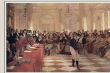
И.Е. Репин. Пушкин на лицейском акте. Холст, масло. 1911. [ВМГ]

На публичном экзамене знаменитый поэт Державин высоко оценил талант юного Александра.