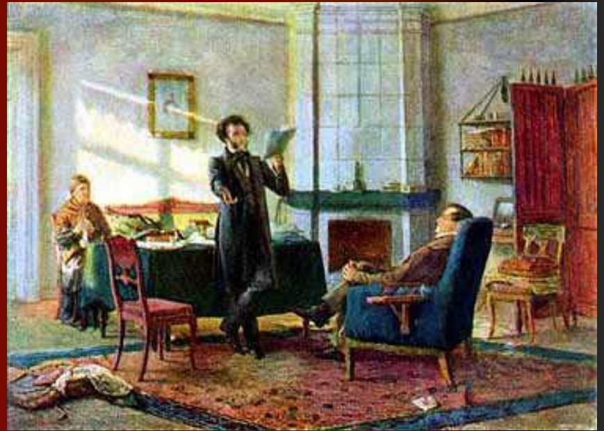
Пушкин в селе Михайловском (Пушкин у Пушкина). Н.Н. Ге. 1875 г.

В конце июля 1824 года ссылка в родительское имение Михайловское Псковской Губернии За три года ссылки написаны "Кавказский пленник", "Бахчисарайский фонтан", а также "Узник", "Песнь о Вещем Олеге". Начат роман в стихах "Евгений Онегин".