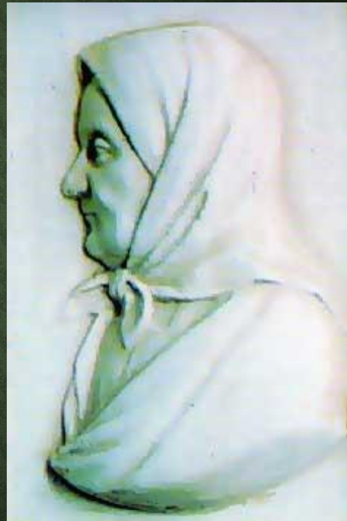
Яковлева Арина Родионовна

Многие ее сказки Пушкин использовал впоследствии как сюжеты собственных сказок (в стихах).