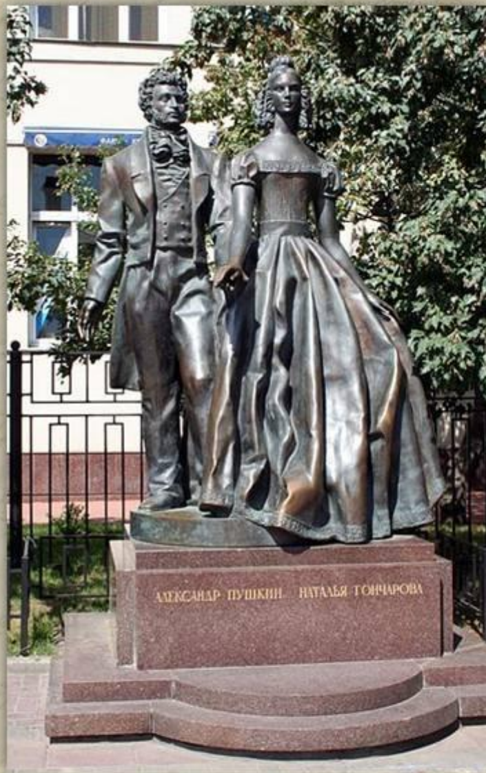
Памятник Пушкину и Гончаровой на Арбате. Скульптор — А. Н. Бурганов