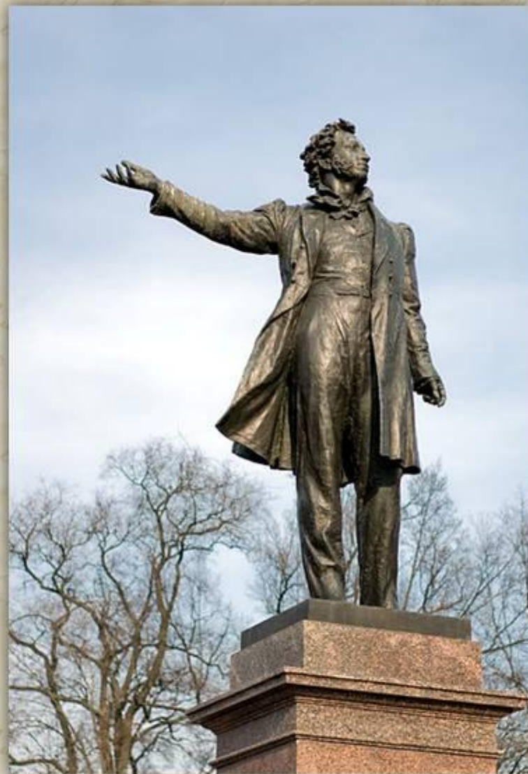
Памятник на площади Искусств в Санкт-Петербурге.