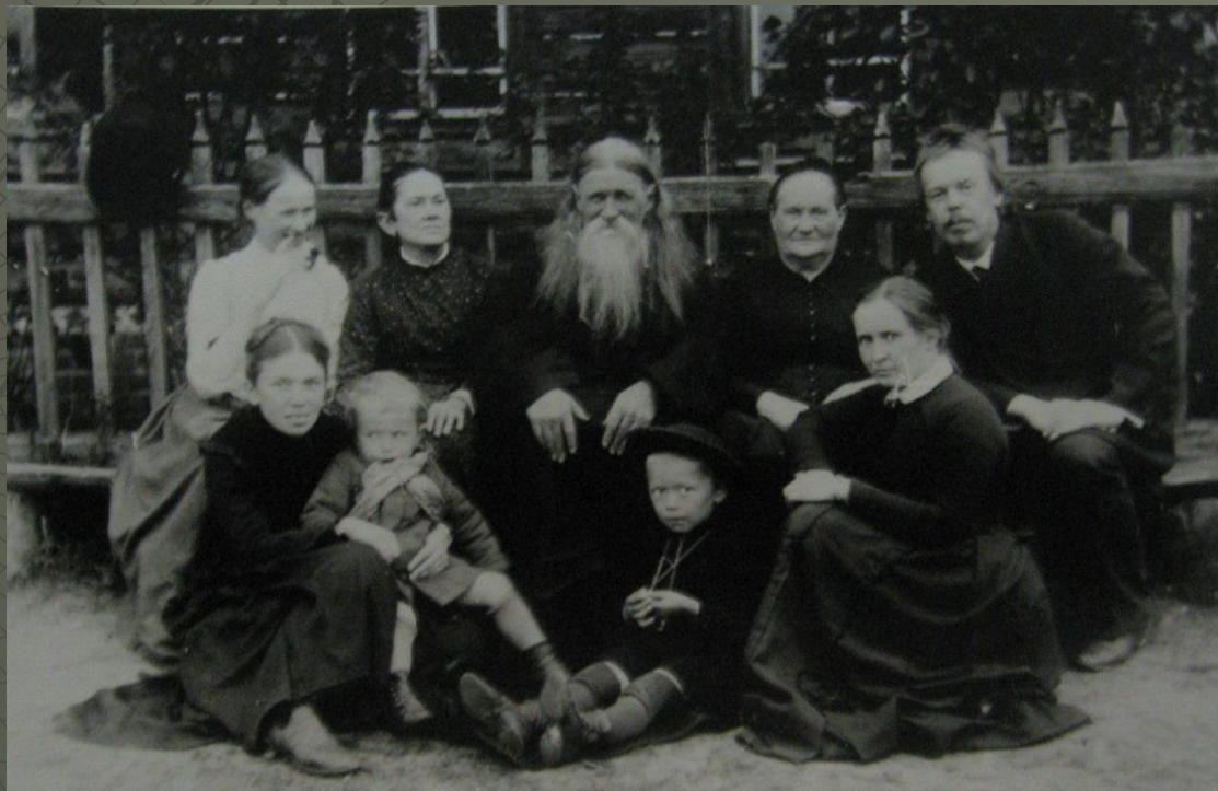
Фото из семейного альбома Поповых, 1895 год

◆ Мальчик рос быстро, хотя с первых же дней оказался слабым и болезненным. Худой белокурый Сашура, как звали Попова в детстве, вскоре стал любимцем всей семьи. Страстью мальчика была техника. Целыми днями просиживал он в своей мастерской, которую оборудовал в чулане отцовского дома. На ручье, что протекал внизу, за домом Поповых, Саша сделал игрушечный завод.