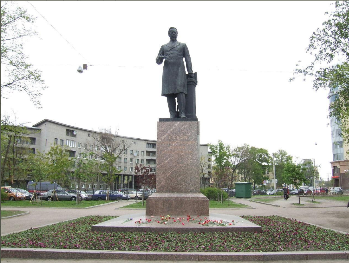
Памятник физику Попову А.С.: Каменноостровский проспект, сквер между домами 39 и 41, Петроградский район, Санкт-Петербург