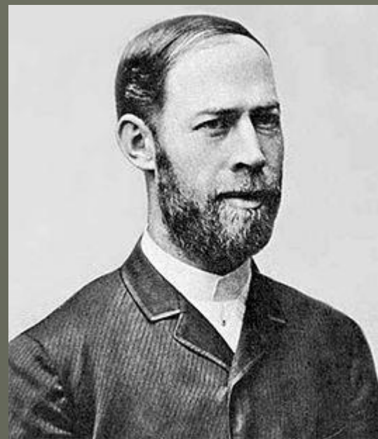
Генрих Рудольф Герц

В самом деле, было трудно увидеть в слабых искорках, которые Герц рассматривал в лупу, будущее средство связи. Однако Александру Степановичу Попову это удалось. Примерно, через год после смерти Генриха Герца Попов продемонстрировал первый радиоприёмник открывший возможность практического использования электромагнитных волн для целей беспроводной связи.