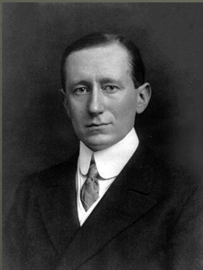
Гульельмо Маркони 1874-1937