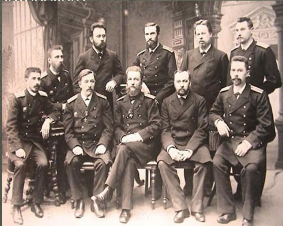
А.С.Попов (стоит второй справа) среди преподавателей Минного офицерского класса 1886 год.