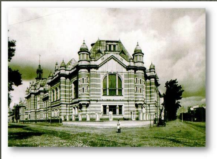
Здание Электротехнического института в начале века

С 1810-х годов магистраль носила название Песочный проспект, с середины XIX века — Песочная улица. В августе 1940 года она получила название улица Профессора Попова — в честь профессора А. С. Попова, который с 1901 года до своей смерти в 1906 году жил в здании Электротехнического института на этой улице.