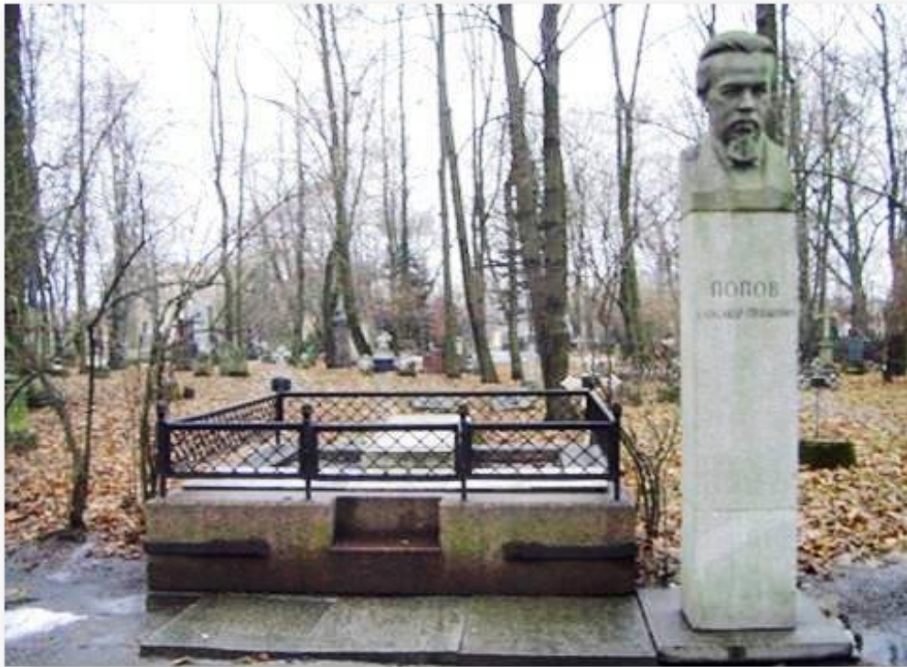
Могила А.С. Попова на Волковском кладбище