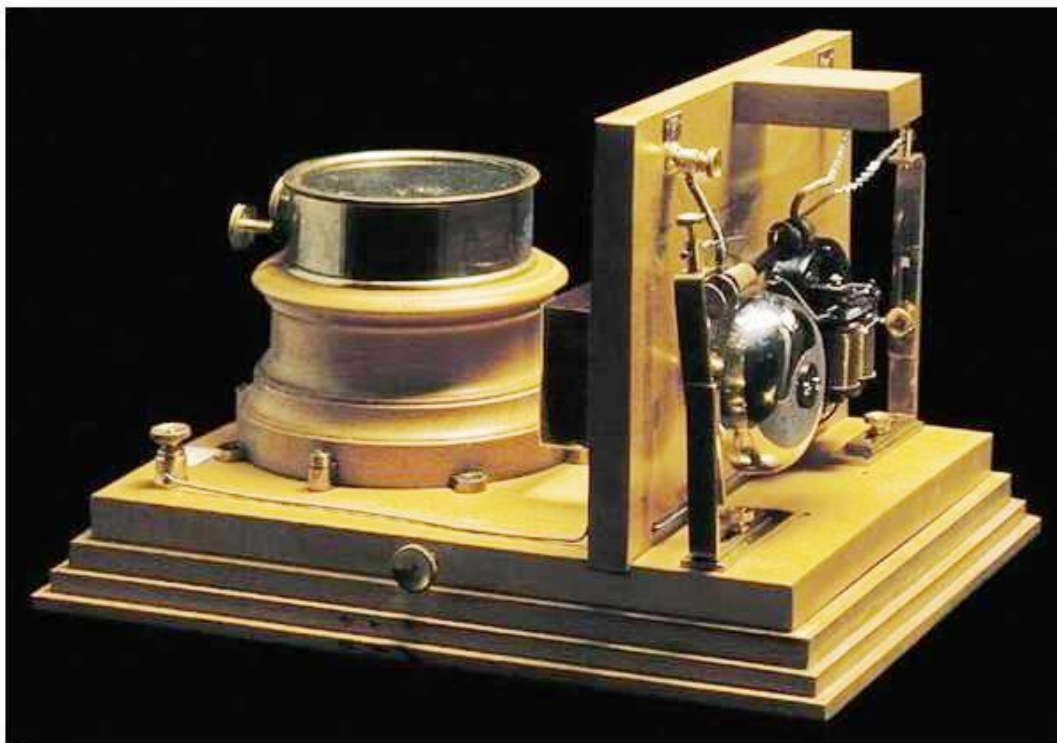
Первый радиоприёмник, изобретённый А.С.Поповым в 1895 году.

◆ Сам Попов между прочим писал: «Соотношение между моими работами и опытами Маркони действительно очень тесно... В июне были опубликованы известным физиком В.Г. Присом результаты опытов Маркони и подробности приборов, причем оказалось, что приемник Маркони по своим составным частям одинаков с моим прибором, построенным в 1895 г.».