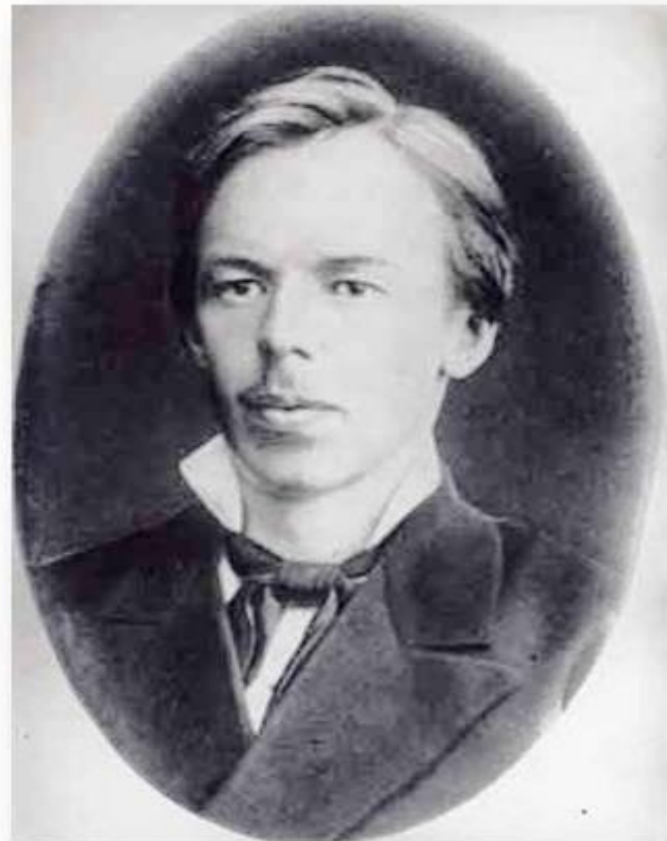
А.С.Попов в 1877 году перед поступлением в университет, г. Санкт-Петербург, 1877 г.

◆ После окончания в 1877 году общеобразовательных классов Пермской духовной семинарии он не стал продолжать духовное образование, а поступил на физико-математический факультет Петербургского университета. В университете его увлекала электротехника. Он работал монтером в товариществе «Электротехник», и впервые его труды в 1882 году были посвящены динамоэлектрическим машинам.