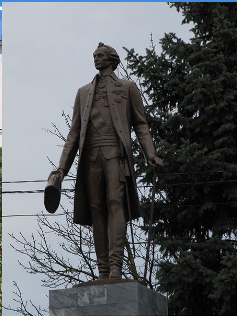
Памятник в станции Ленинградская .