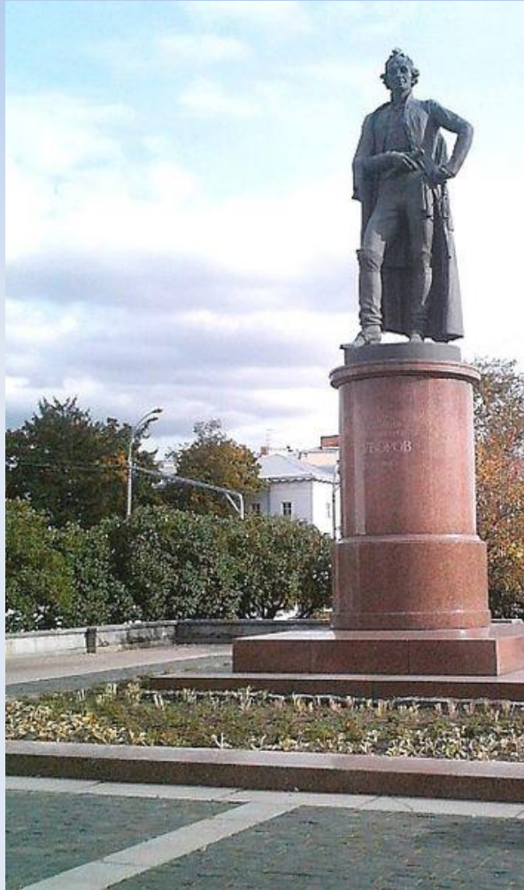
Памятник в Москве . Скульптор О. К. Комое .