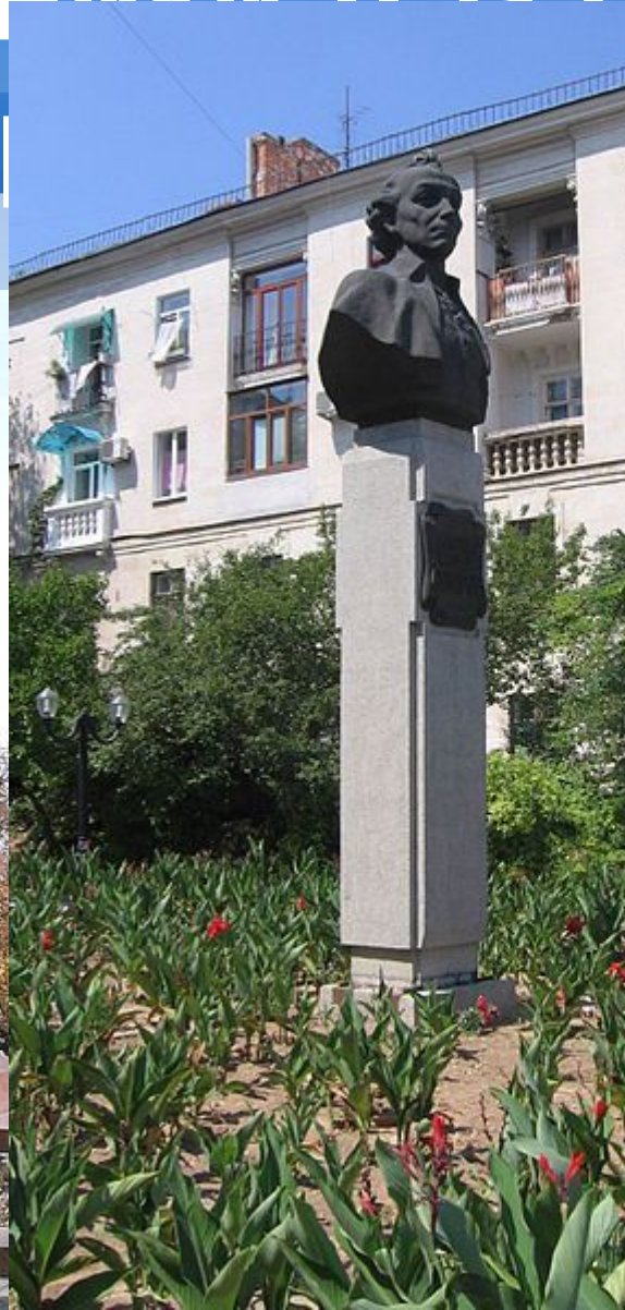
Памятник Суворову в Херсоне .