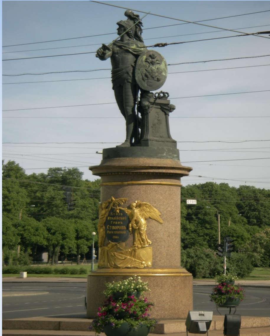
Козловский М. И. Памятник А.В.Суворову на Суворовской площади в Петербурге

Среди балтийских солнечных просторов, Над широко распахнутой Невой, Как бог войны, встал бронзовый Суворов Виденьем русской славы боевой.