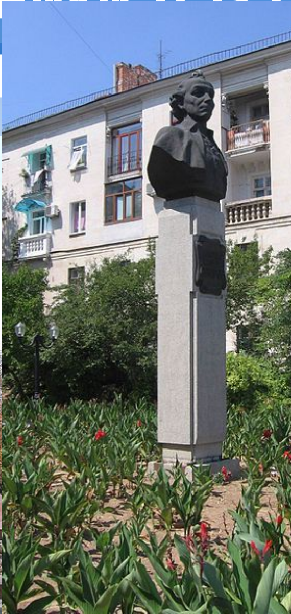
Памятник Суворову в Херсоне .