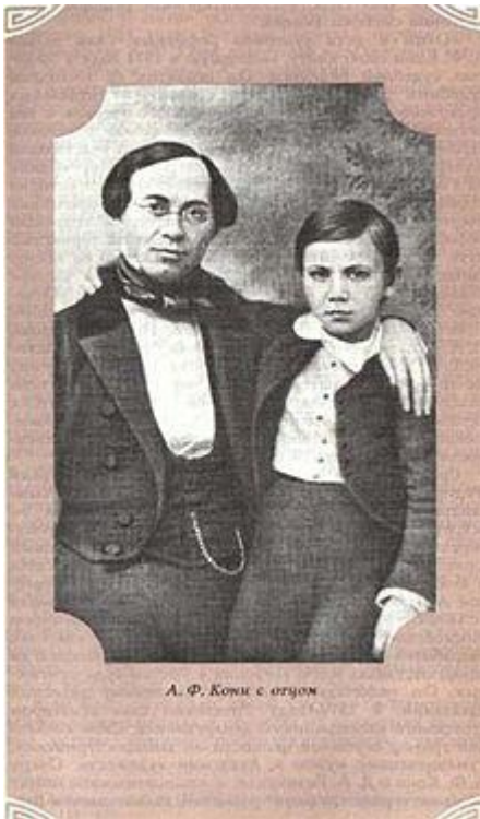
А. Ф. Кони с отцом