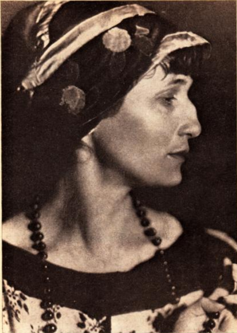
А. А. Ахматова. 1925