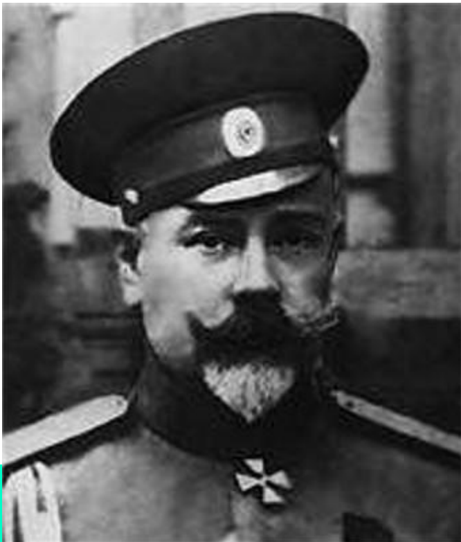
АНТОН ИВАНОВИЧ ДЕНИКИН (1872-1947)