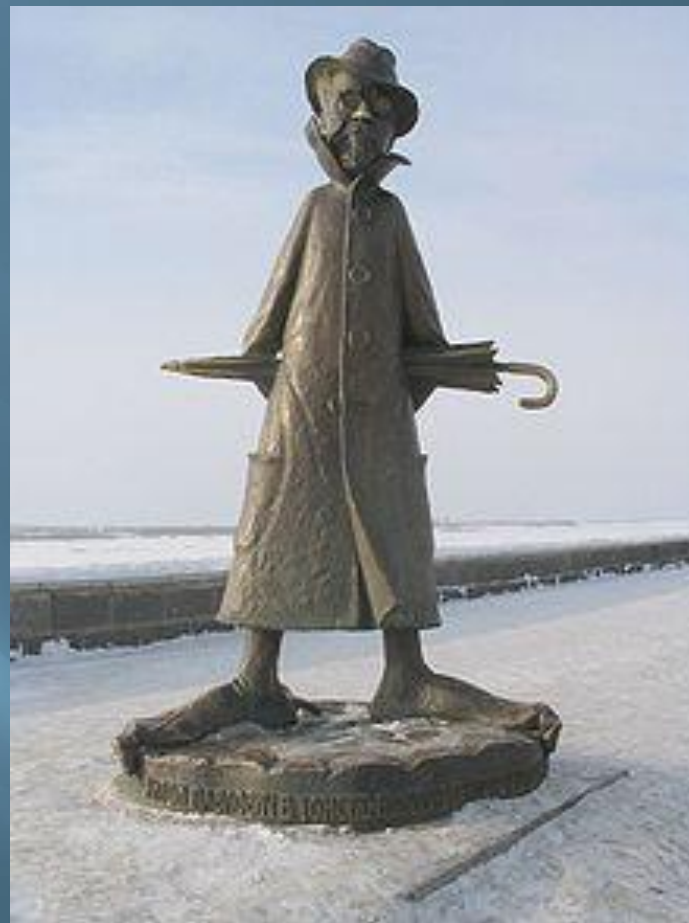
▣ Памятник в Томске