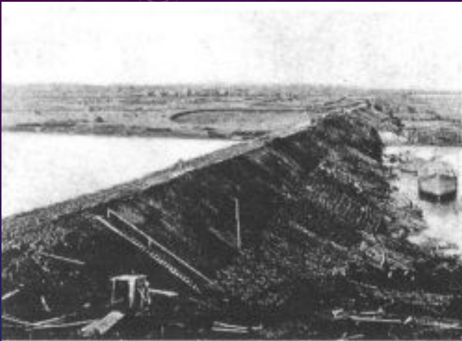
Строительство железнодорожной насыпи у Исакогорки. 1908 г.