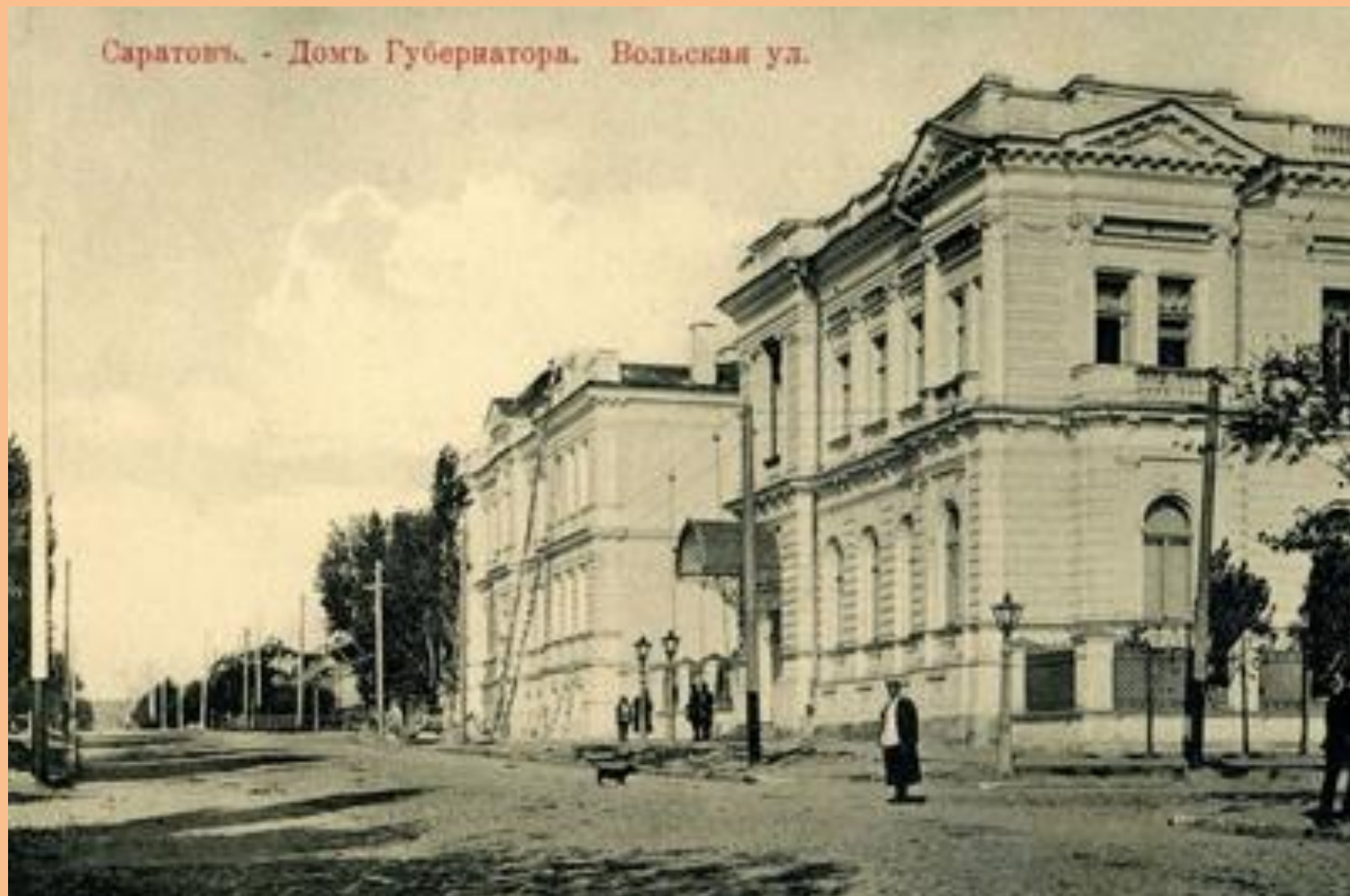
Саратовъ. - Домъ Губернатора. Вольская ул.