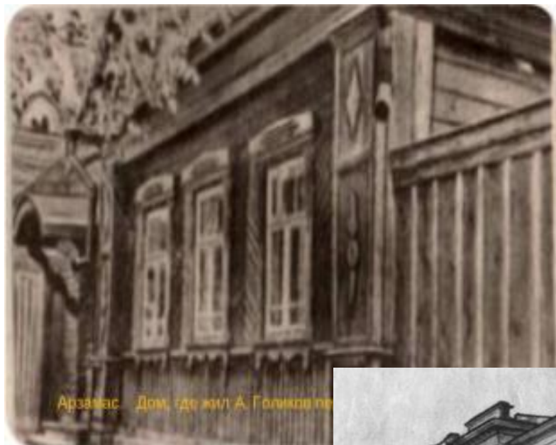
Арзамас Дом, где жил А. Голиков

Дом, в котором жил А. Голиков перед уходом на фронт