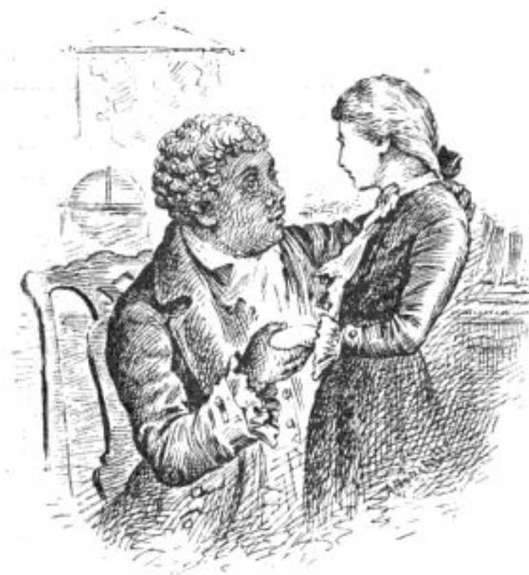
HANNIBAL AND SUVOROFF.