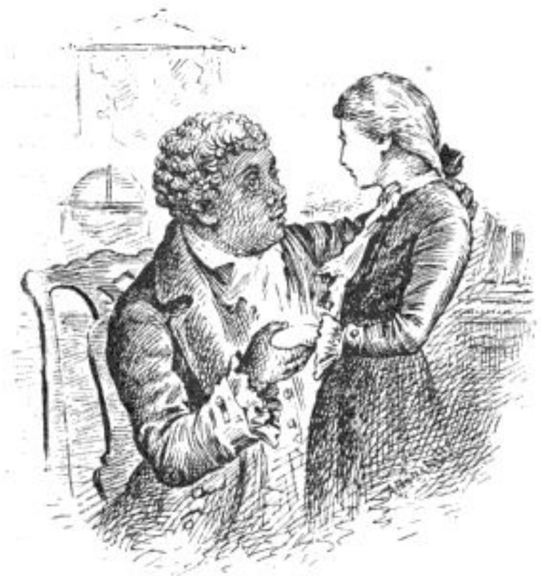
HANNIBAL AND SUVOROFF.