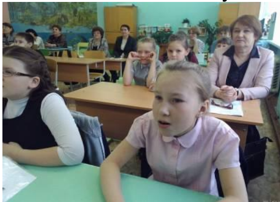
Научно-практическая конференция- 2016г.