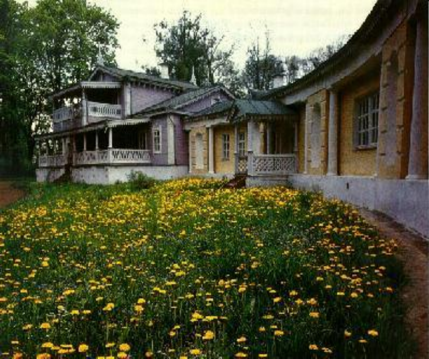
Мценский уезд Орловской губернии