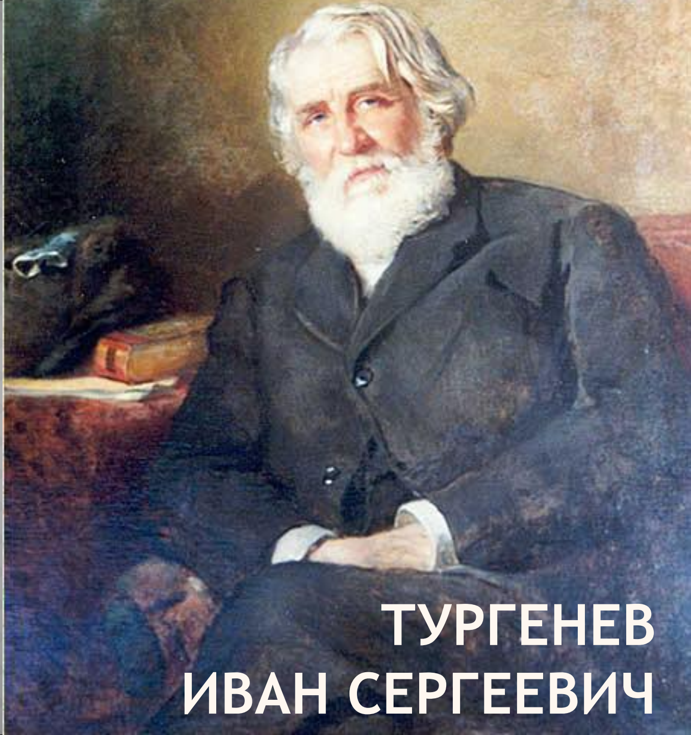
ТУРГЕНЕВ ИВАН СЕРГЕЕВИЧ