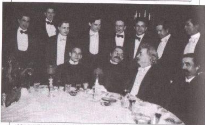
Максим Горький и Марк Твен в клубе писателей. Нью-Йорк, 1906