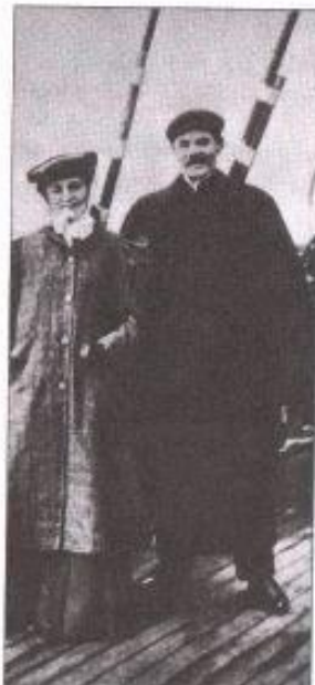
М. Горький и М. Андреева на пути в Америку. 1906

Статья «Буря энтузиазма...» о приезде Горького в США в газете «Нью-Йорк Таймс»