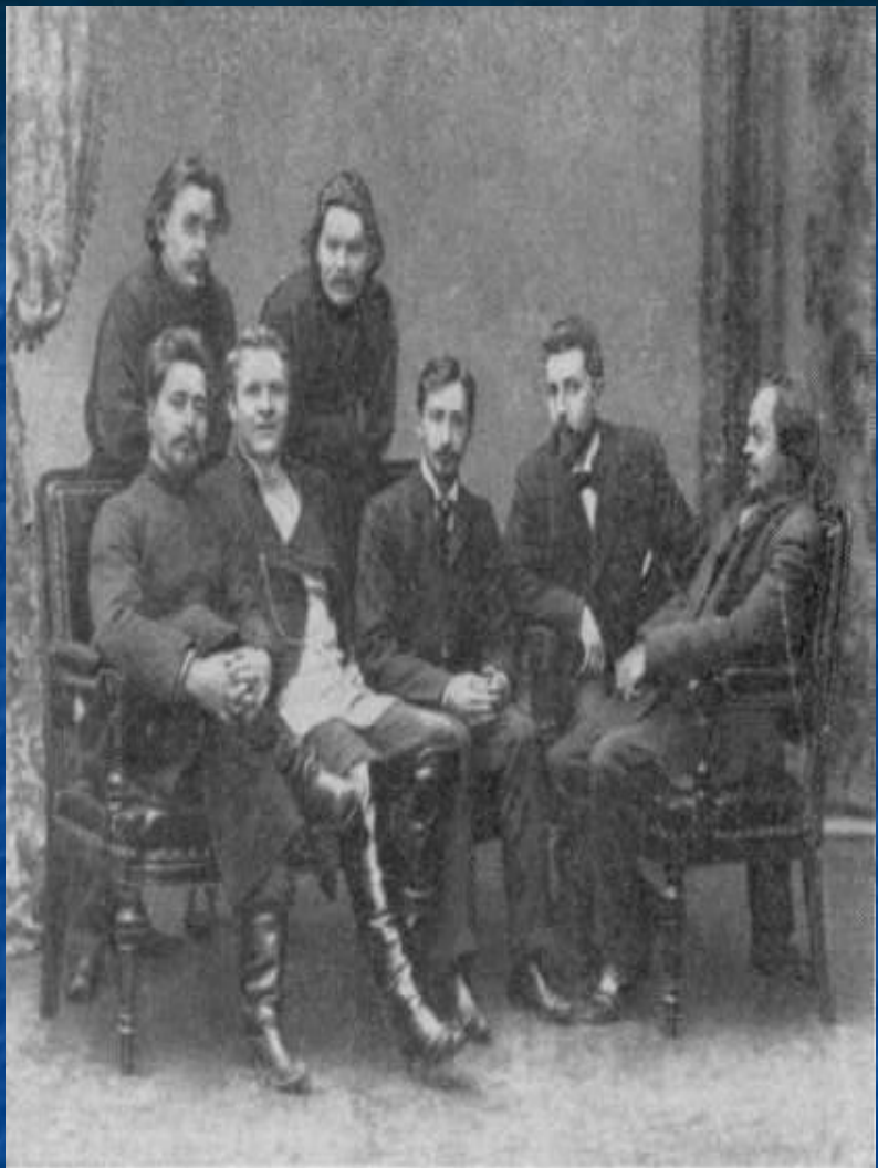
«Среда». Сидят — Л. Н. Андреев, Ф. И. Шаляпин, И. А. Бунин, Н. Д. Телешов, Е. Н. Чириков; стоят — С. Г. Скиталец, М. Горький. Фотография.

Общественная позиция Горького была радикальной. Он не раз подвергался арестам, в 1902 Николай II распорядился аннулировать его избрание почетным академиком по разряду изящной словесности (в знак протеста Чехов и Короленко вышли из Академии). В 1905 вступил в ряды РСДРП (большевистское крыло) и познакомился с В.И.Лениным . Им оказывалась серьезная финансовая поддержка революции 1905-07.