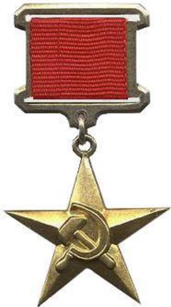
СОЦИАЛИСТИЧЕСКОГО КРАСНОГО ТРУДА