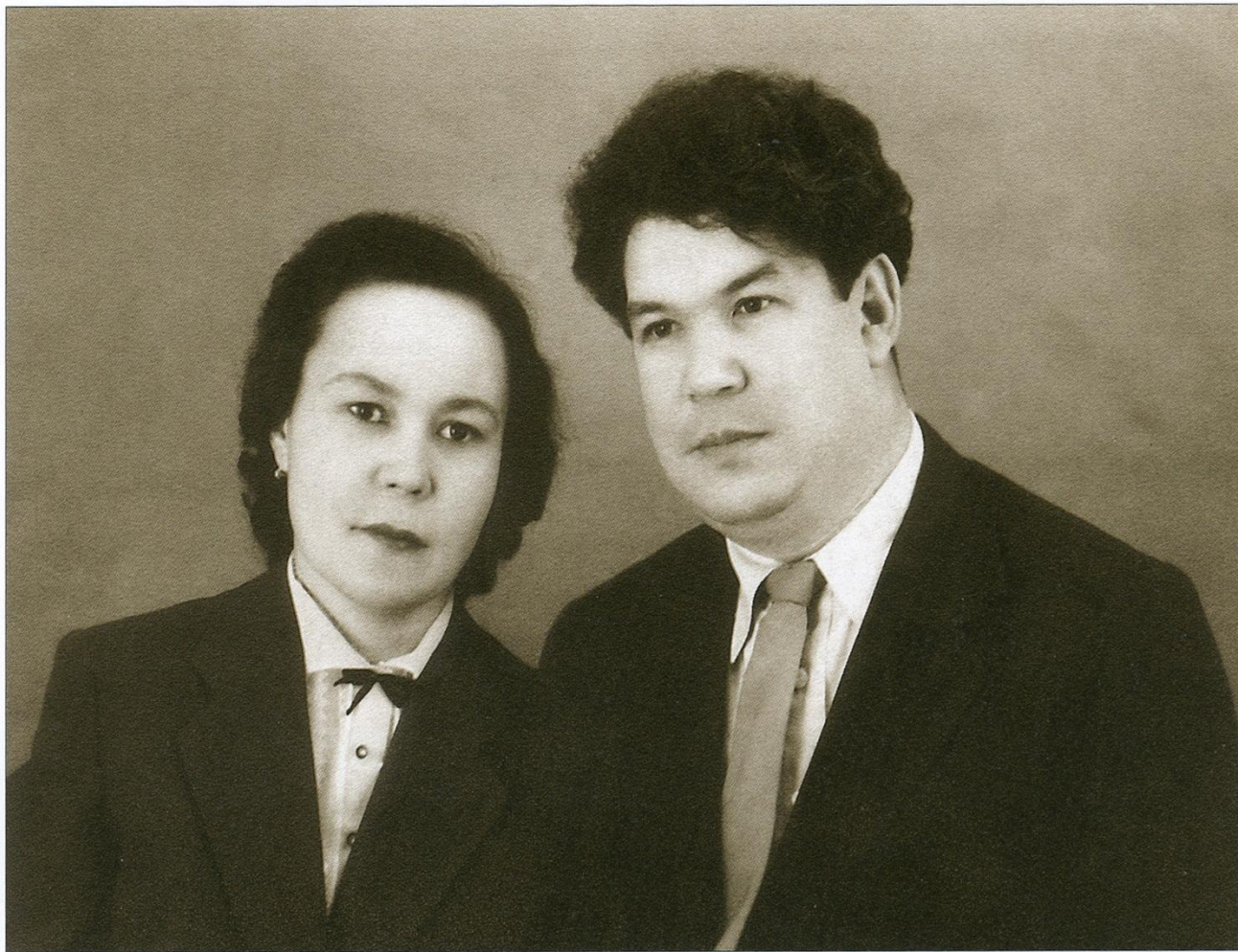
МУСТАЙ КАРИМ СО СВОЕЙ СУПРУГОЙ РОЗОЙ СУФЬЯНОВНОЙ. 1946 Г.