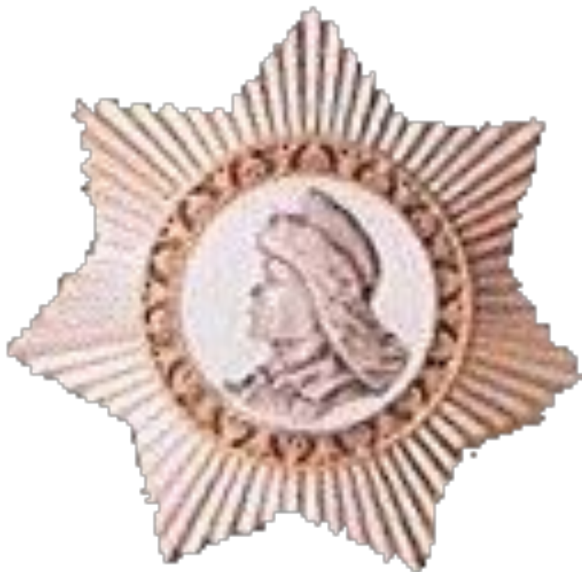
ОРДЕН САЛАВАТА ЮЛАЕВА