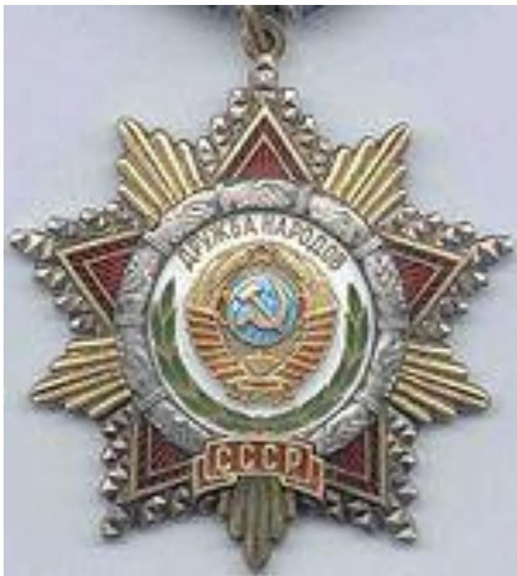
ОРДЕН ДРУЖБЫ НАРОДОВ