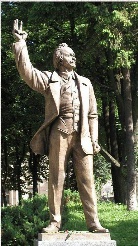
Пам'ятник Вячеславу Чорноволу у Львові

25 березня 1999 року Вячеслав Чорновіл загинув за нез'ясованих обставин в автокатастрофі на шосе під Борисполем.