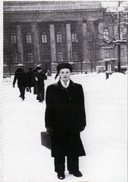
Студент Київського державного університету ім.Тараса Шевченка

В'ячеслав Чорновіл до школи пішов 1946 року відразу до 2-го класу (читав з чотирирічного віку). 1955 року закінчив Вільховецьку середню школу із золотою медаллю і того ж року вступив до Київського державного університету ім. Тараса Шевченка на філологічний факультет, а з 2-го курсу перевівся на факультет журналістики