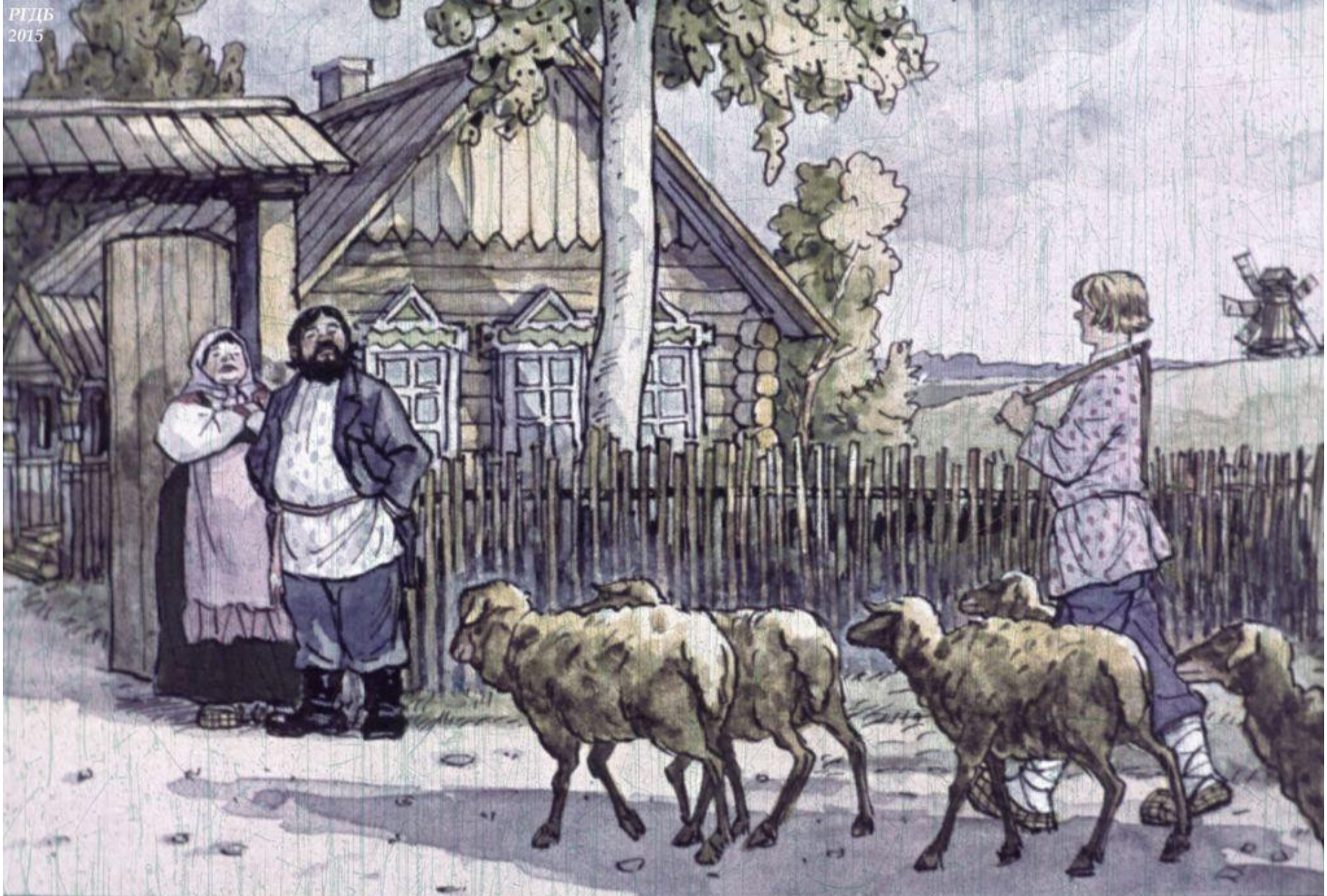
Возвращается Иванушка домой, а хозяин с хозяйкой у ворот стоят – овец считают. Целы овцы. Ни одна не потерялась! 13