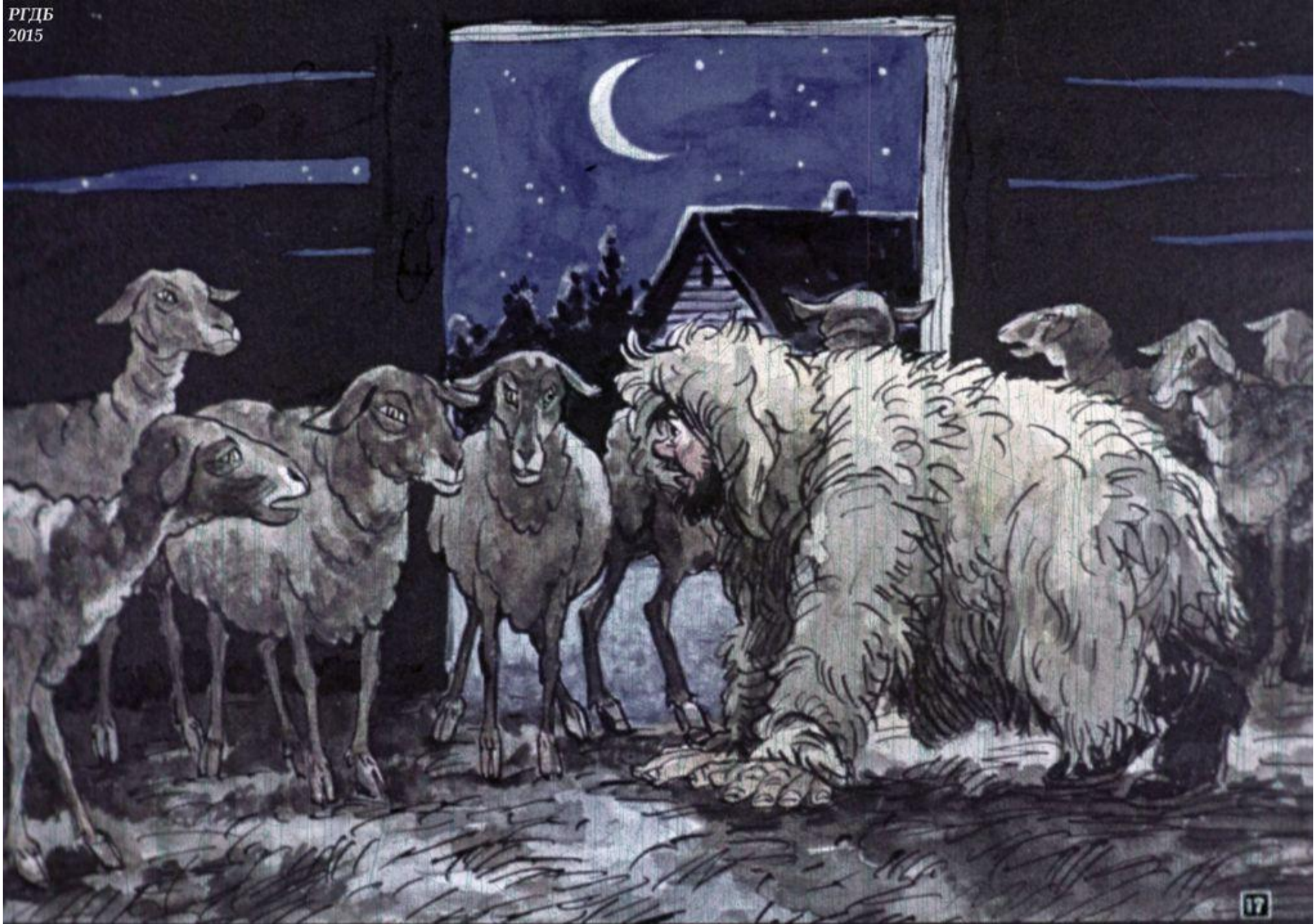
Пробрался потихоньку в хлев и встал среди овец на четвереньки.