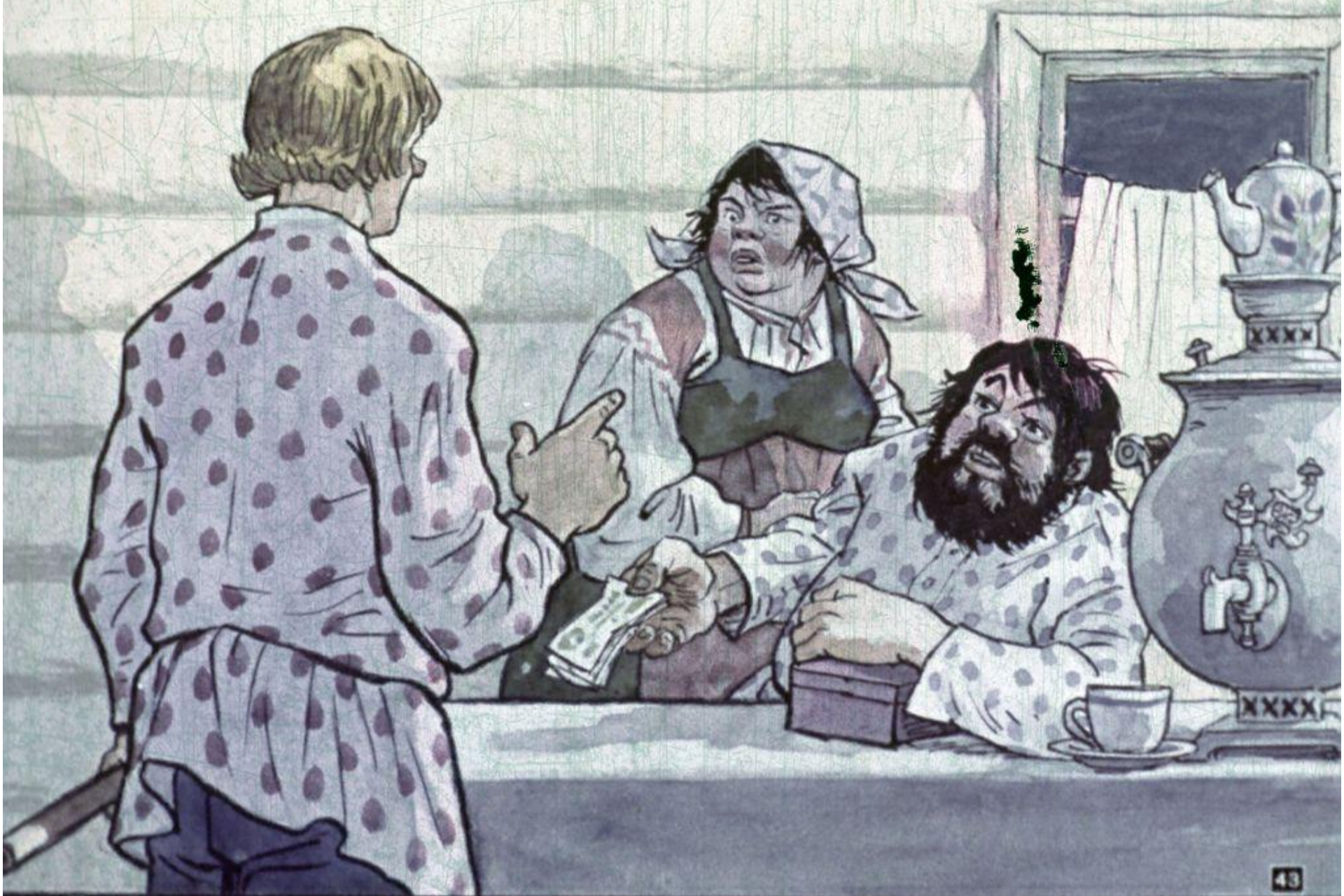
До утра играл Иванушка. Утром получил он своё жалованье...