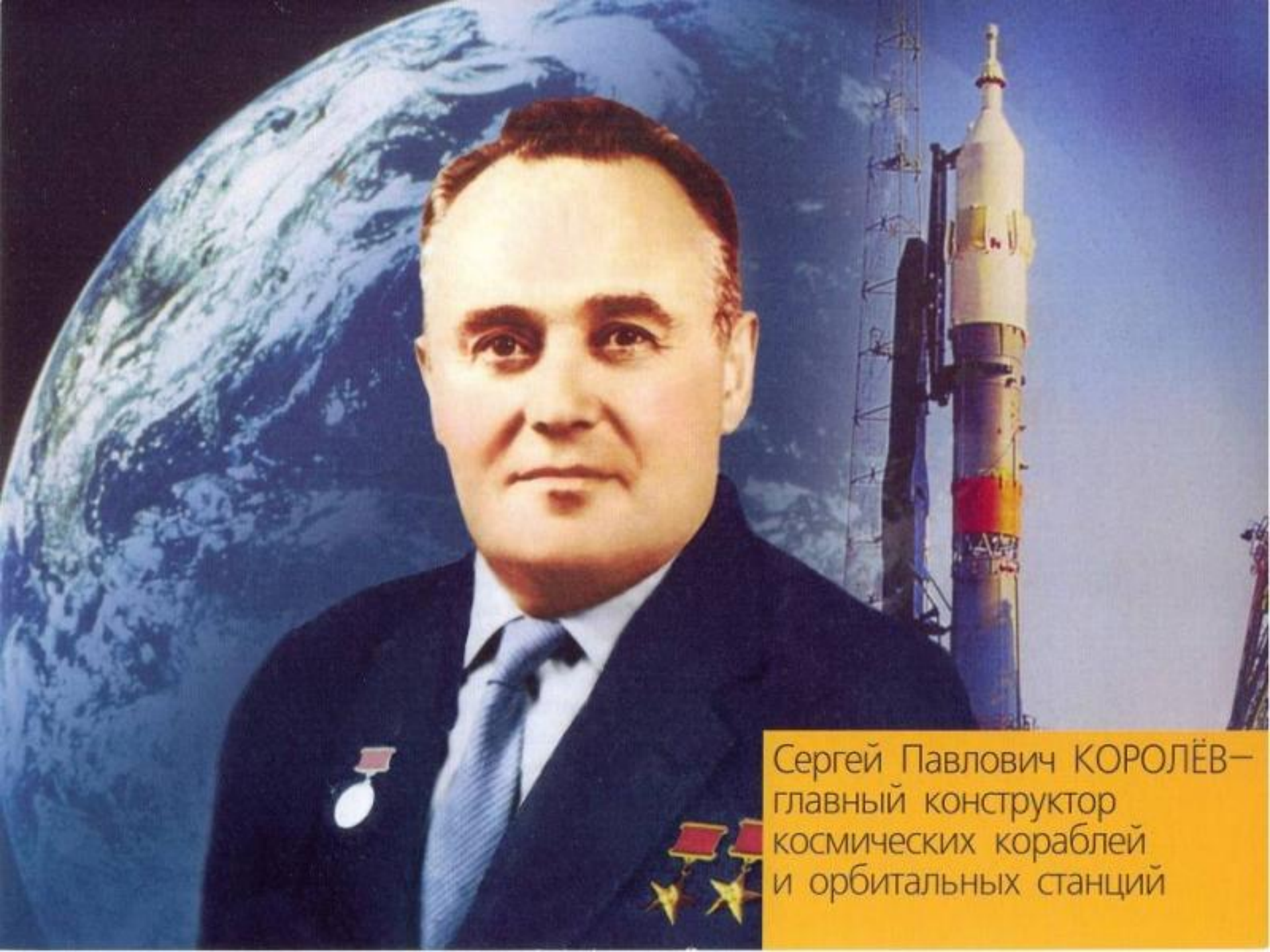
Сергей Павлович КОРОЛЁВ— главный конструктор космических кораблей и орбитальных станций