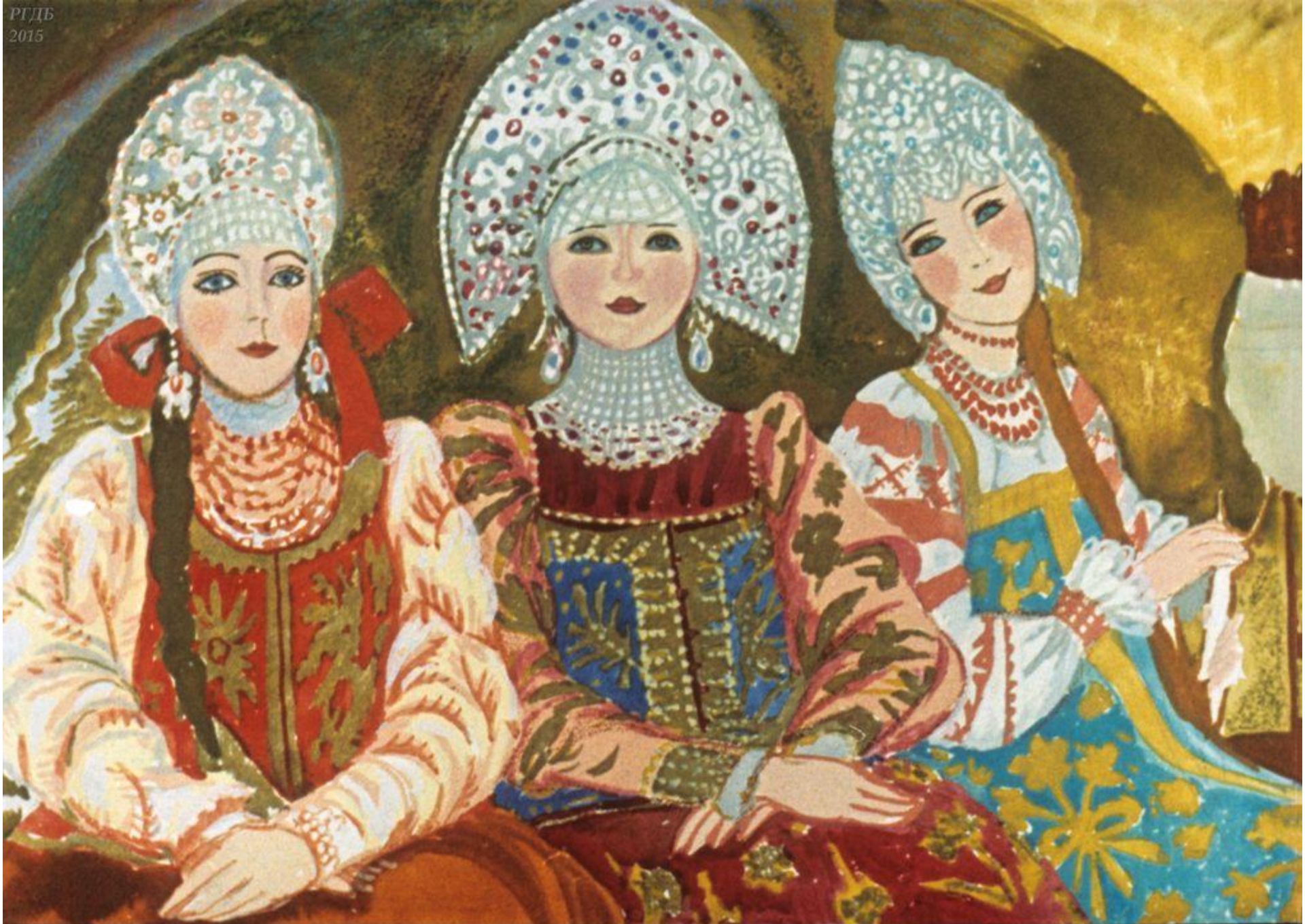
И было у него три дочери, красавицы писаные.