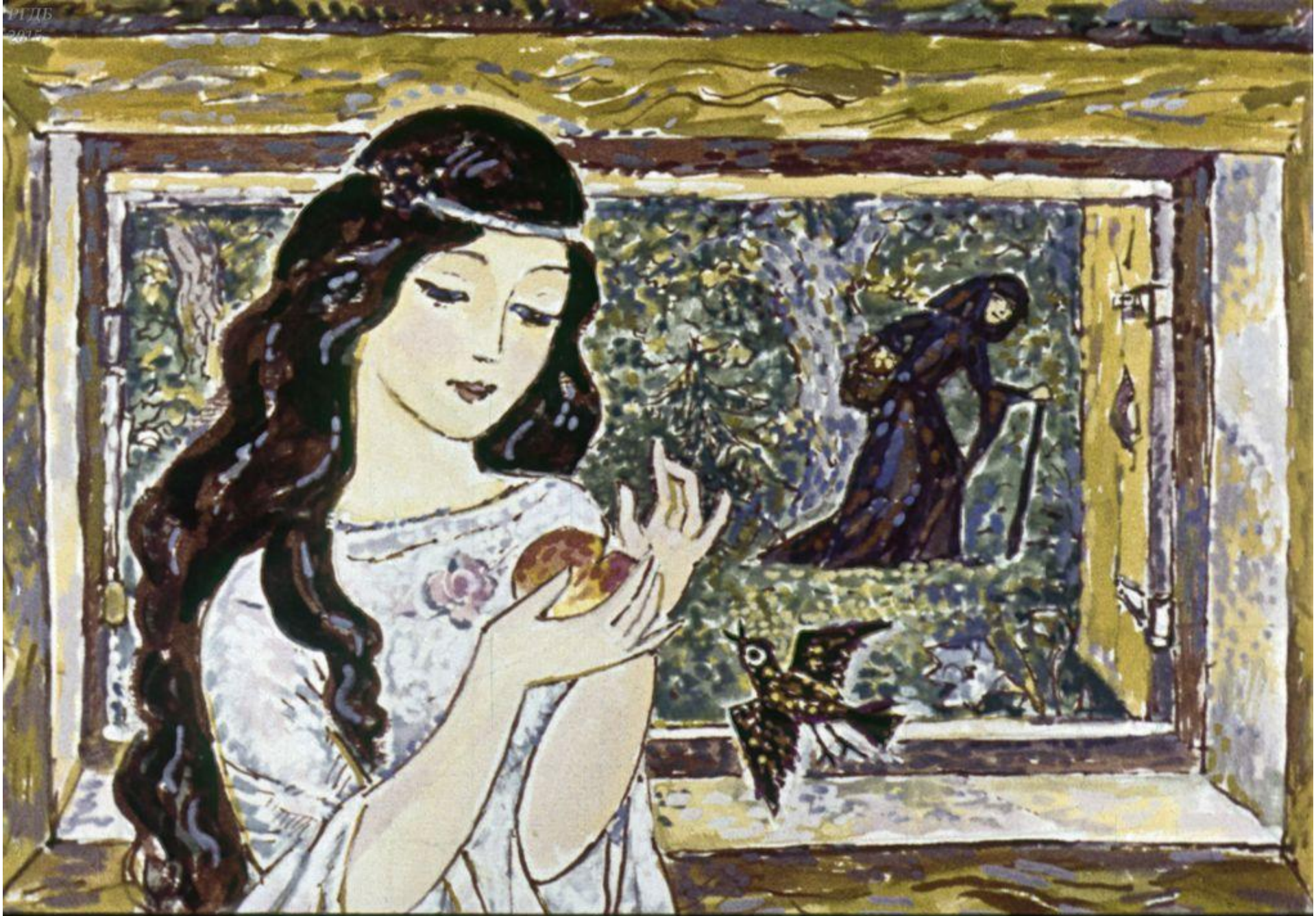
Белоснежка и взяла.