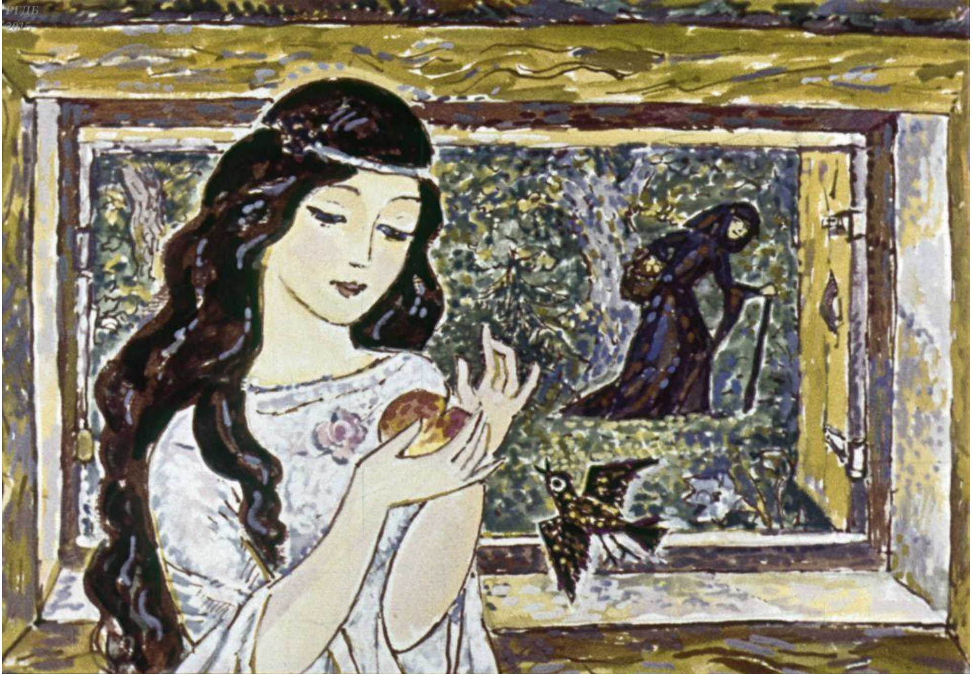
Белоснежка и взяла.