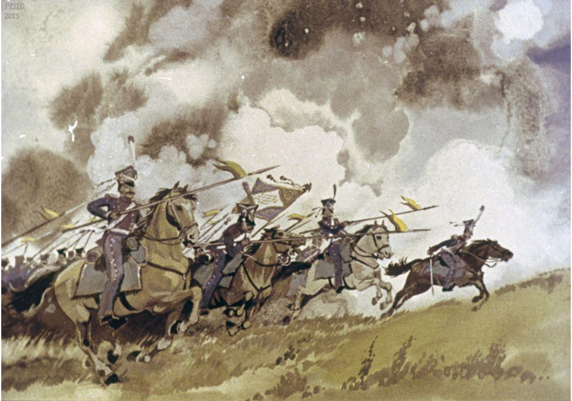
Уланы с пёстрыми значками,