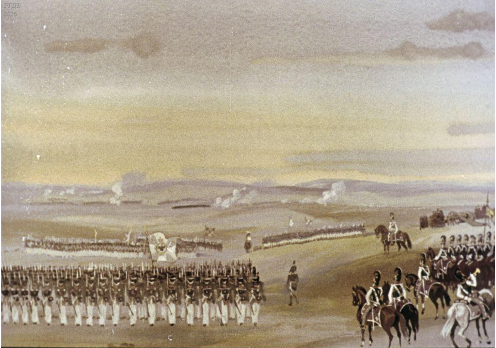
Сверкнул за строем строй.