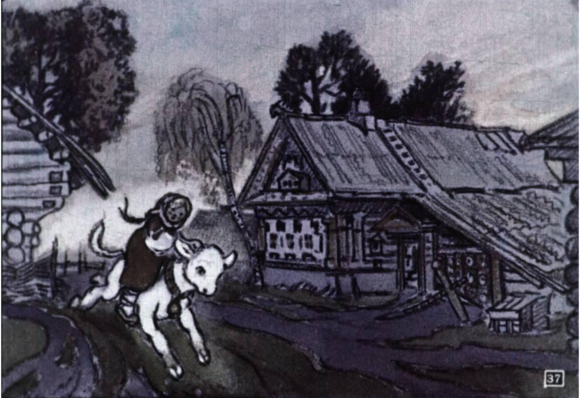
А бычок – чёрный бочок тем временем прибежал в деревню.