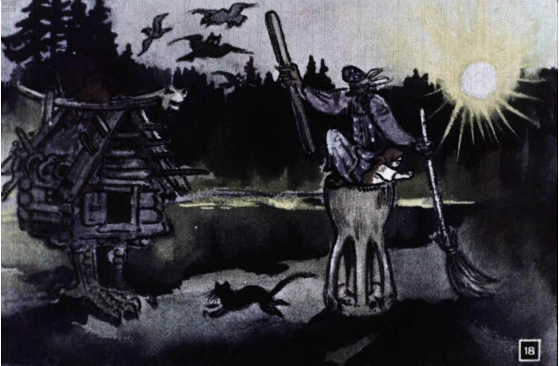
Догнала барана, отняла Нюрочку-девчурочку и при- тащила в свою избушку на курьих ножках.