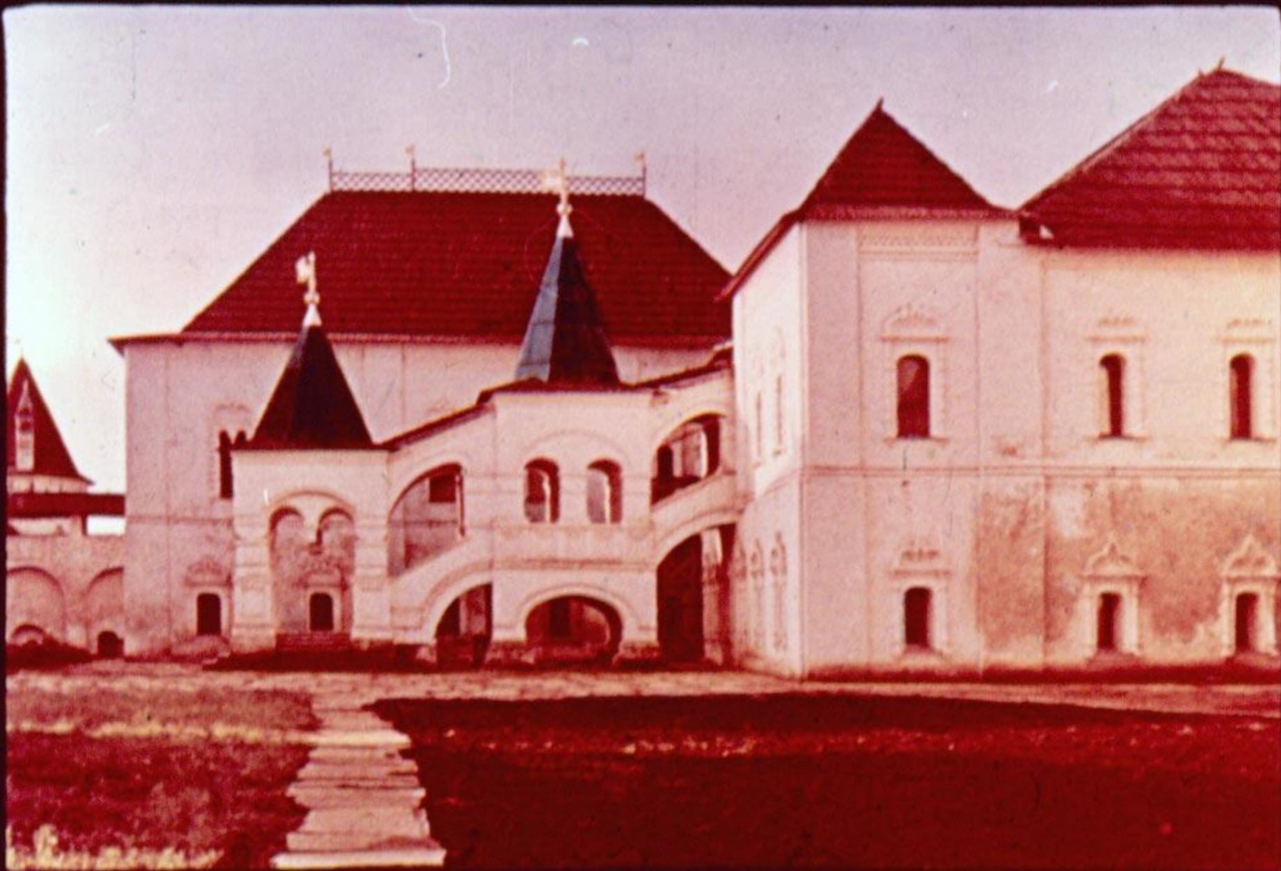
строгие очертания Белых палат,