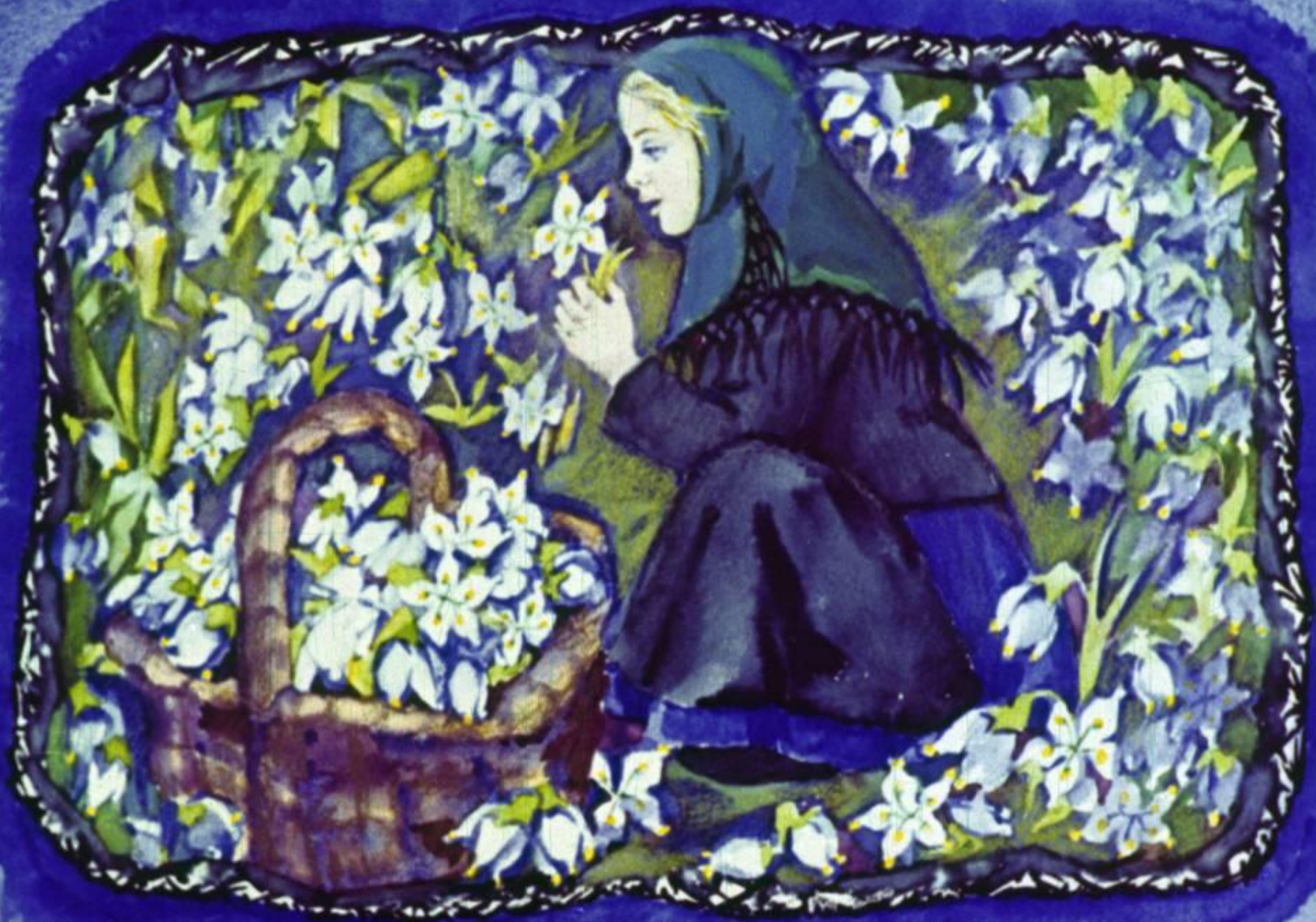
Набрала она полную корзинку