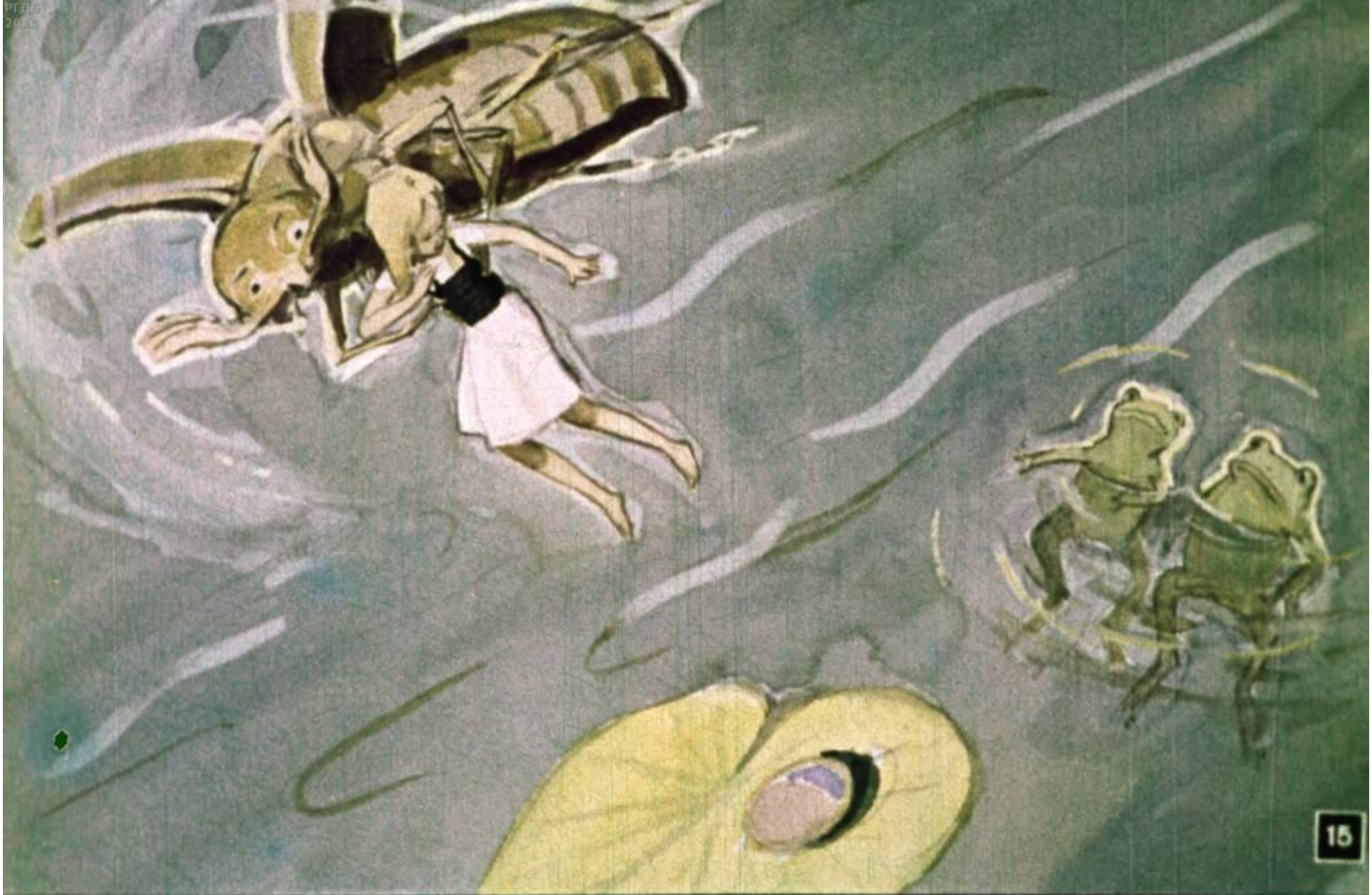
Мимо пролетал майский жук. Он увидел Дюймовочку, схватил её и унёс на дерево.