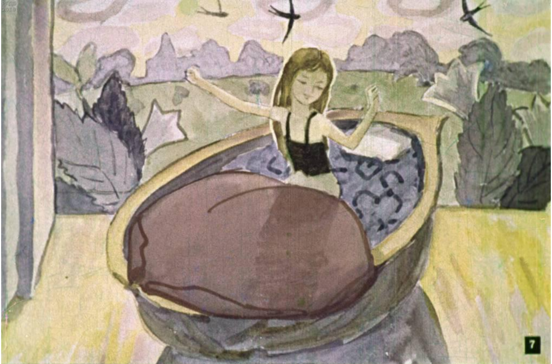
Скорлупка грецкого ореха была её колыбелькой, голубые фиалки – периной, а лепесток розы – одеялом.