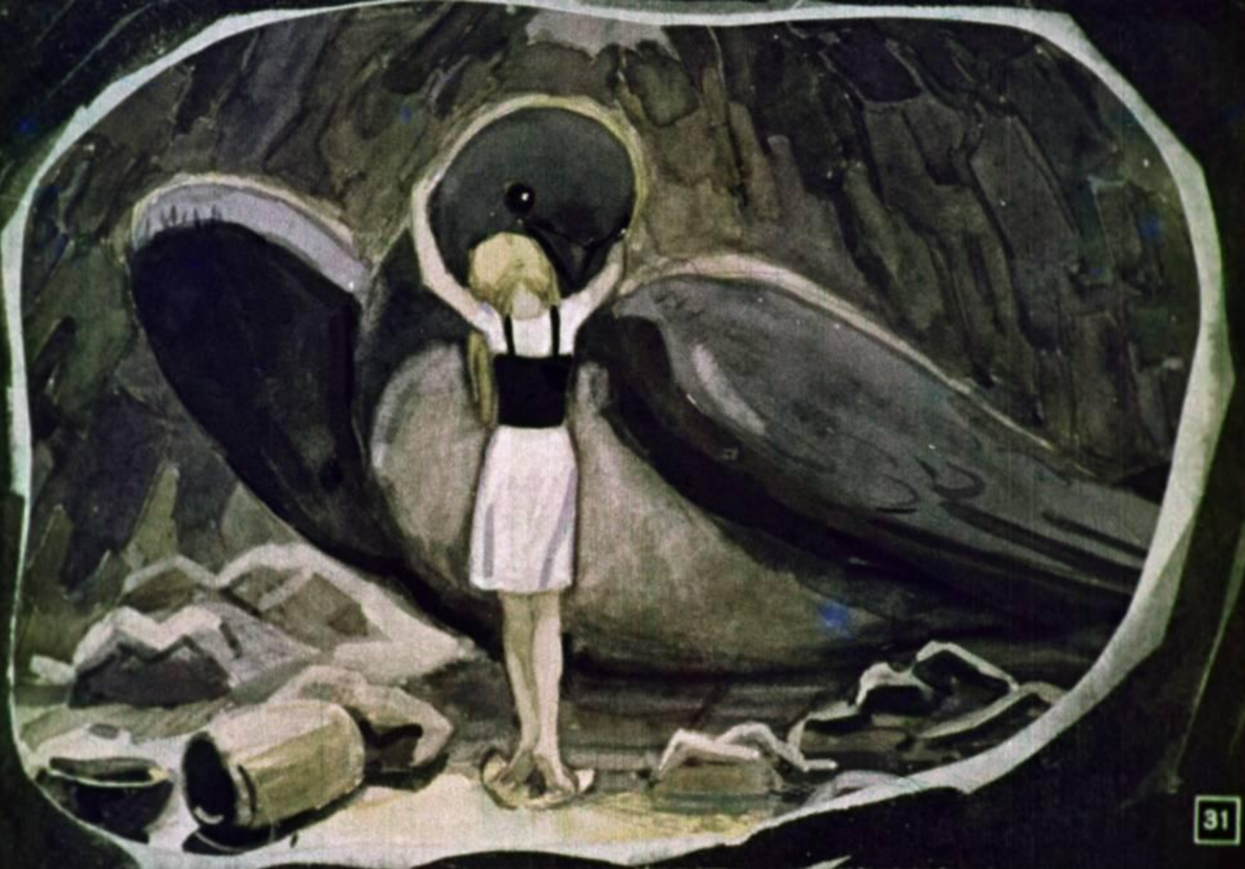
Всю зиму прожила ласточка в подземелье, а Дюймовочка ухаживала за ней.