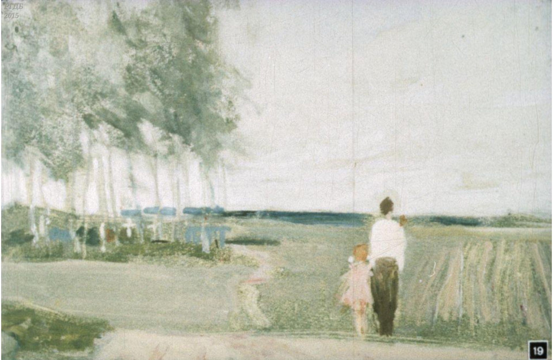
Встретили мы за деревней невысокие зелёные могилы, где лежат те, что своё уже отсеяли и отработали.