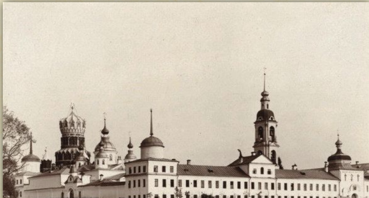
Село Грешнёво Ярославской губернии