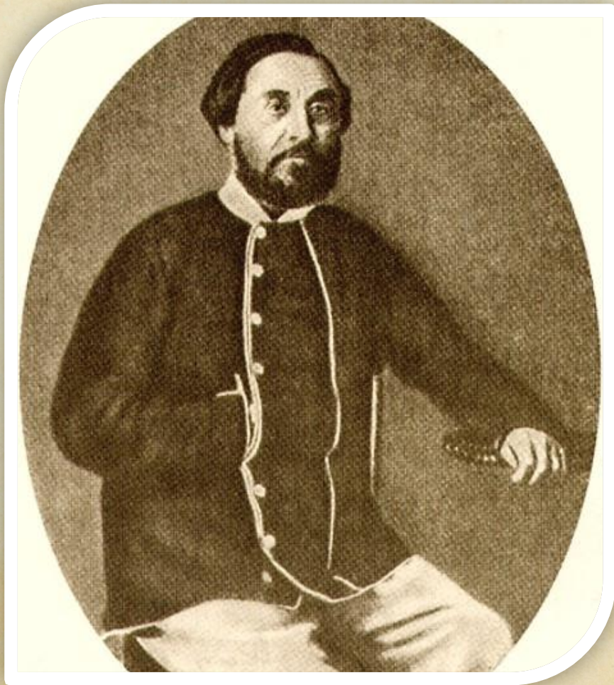
Алексей Некрасов отец поэта