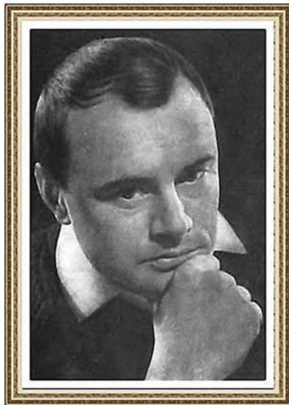
Акимушкин Игорь Иванович (01.05.1929г.— 01.01.1993г.)

советский учёный-биолог, писатель, популяризатор биологии, автор научно-популярных книг о жизни животных.