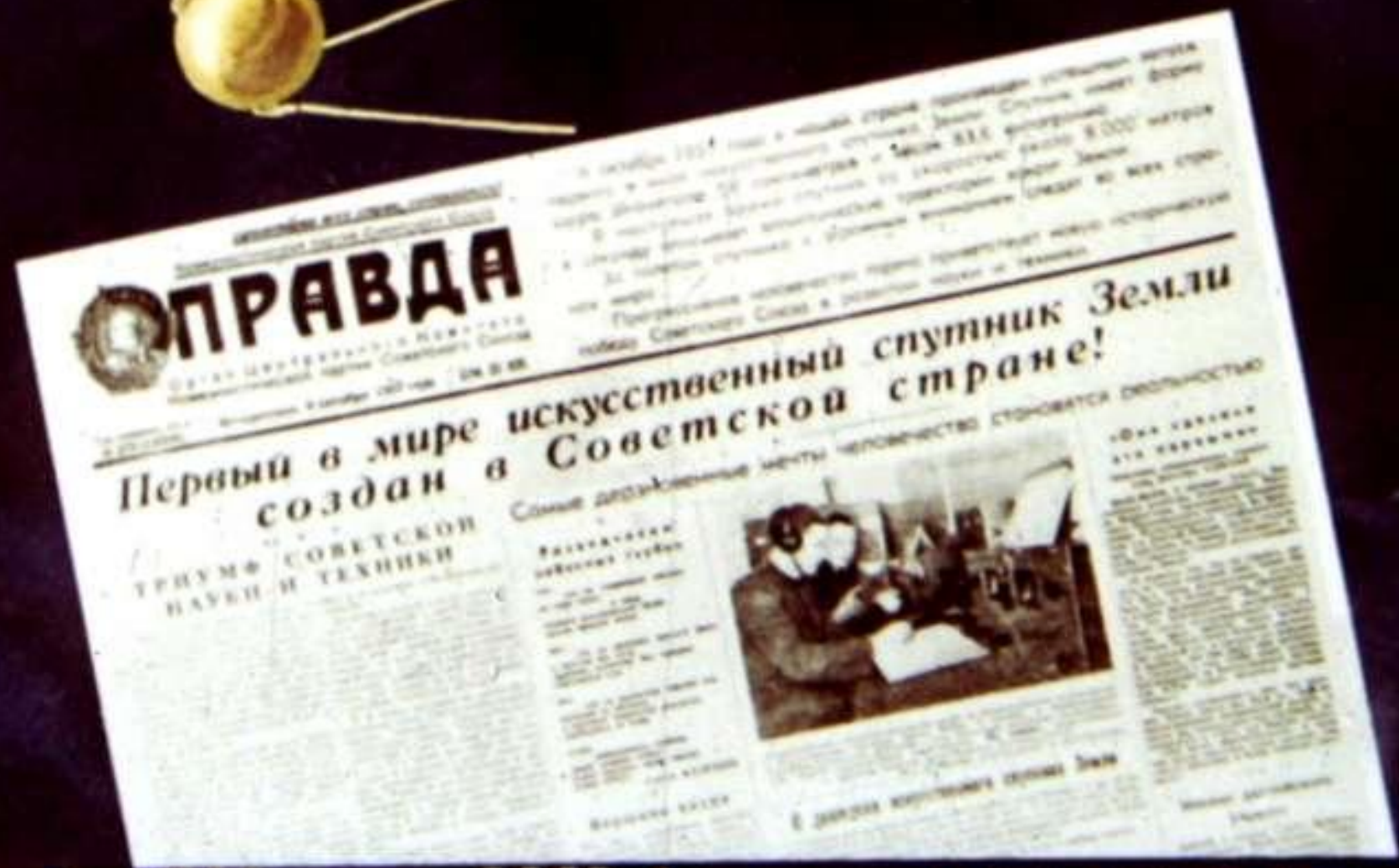
4 октября 1957 года в СССР был осуществлен запуск первого искусственного спутника Земли. И в нашей речи появилось новое слово — «спутник».