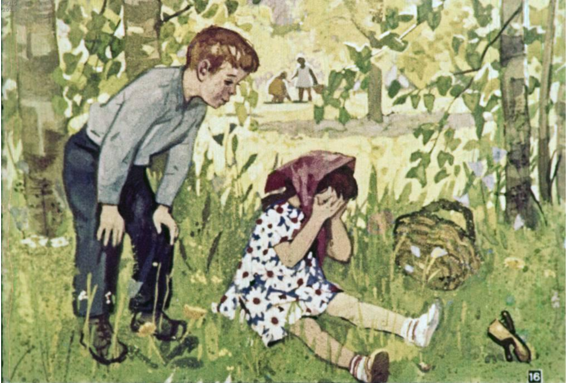
Села на землю и плачет: „Мне вернуться надо, значит“.