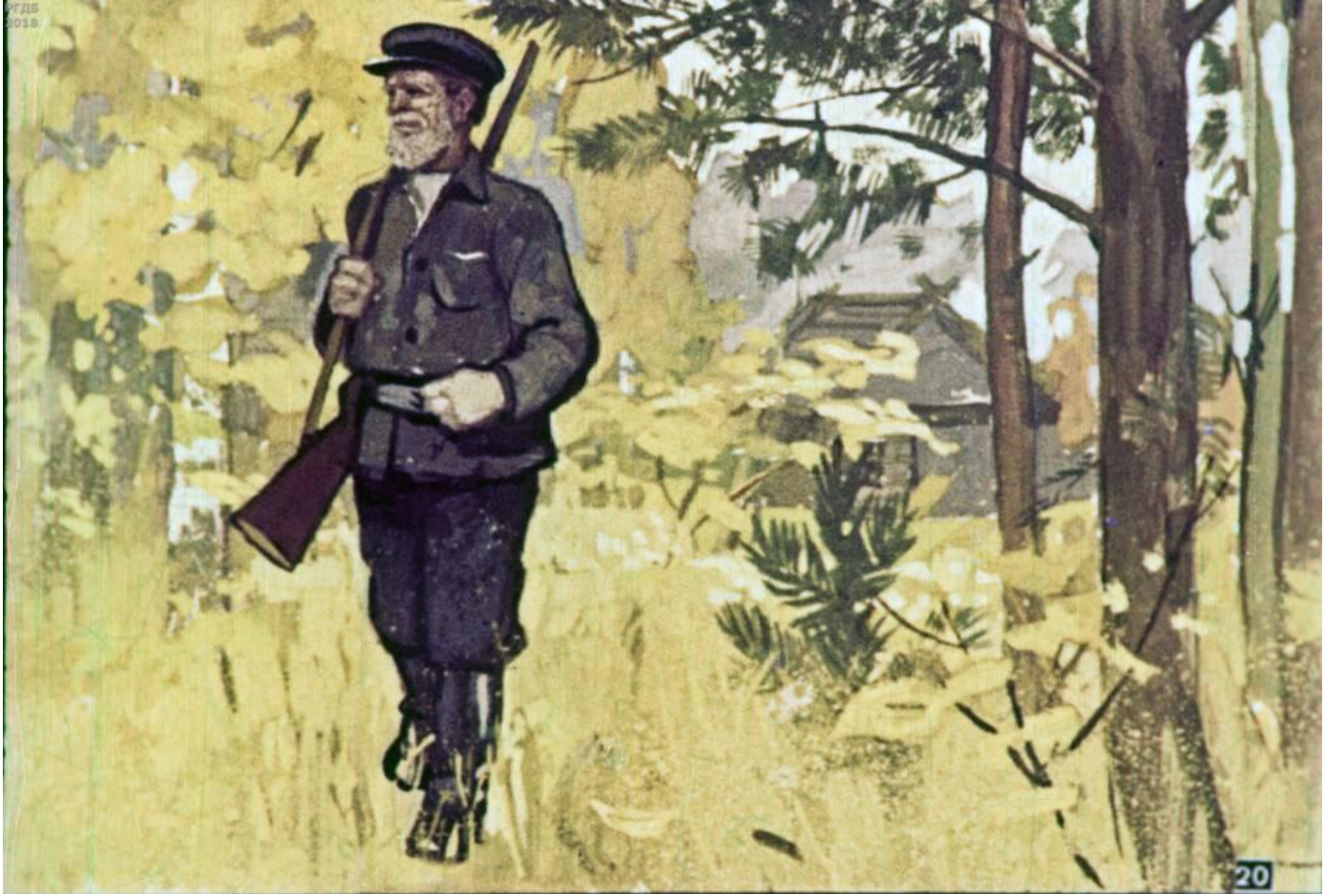
Шёл лесничий из сторожки По глухой лесной дорожке.