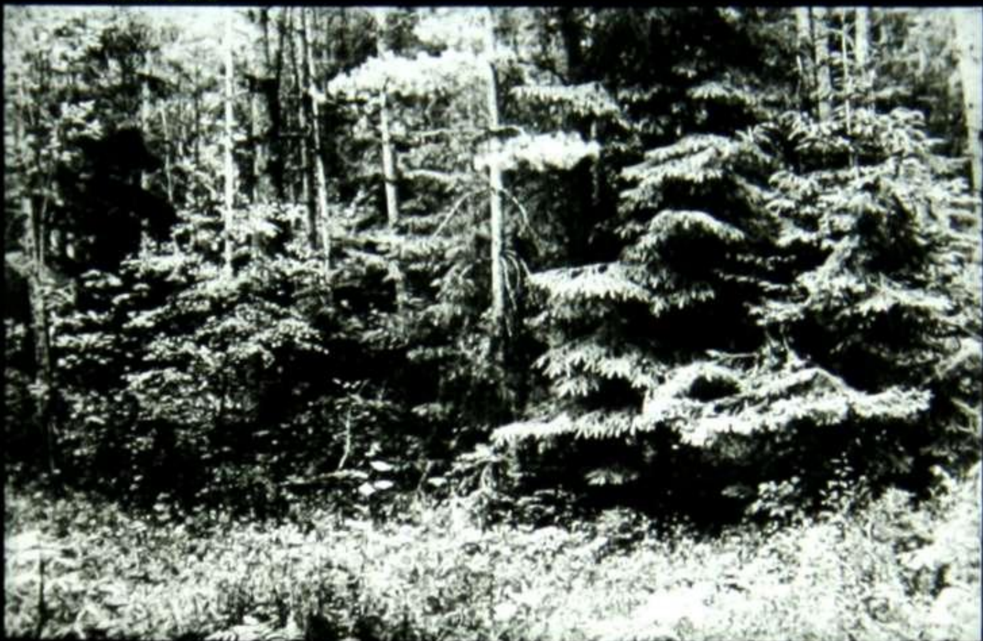
«Мещёра—остаток лесного океана».