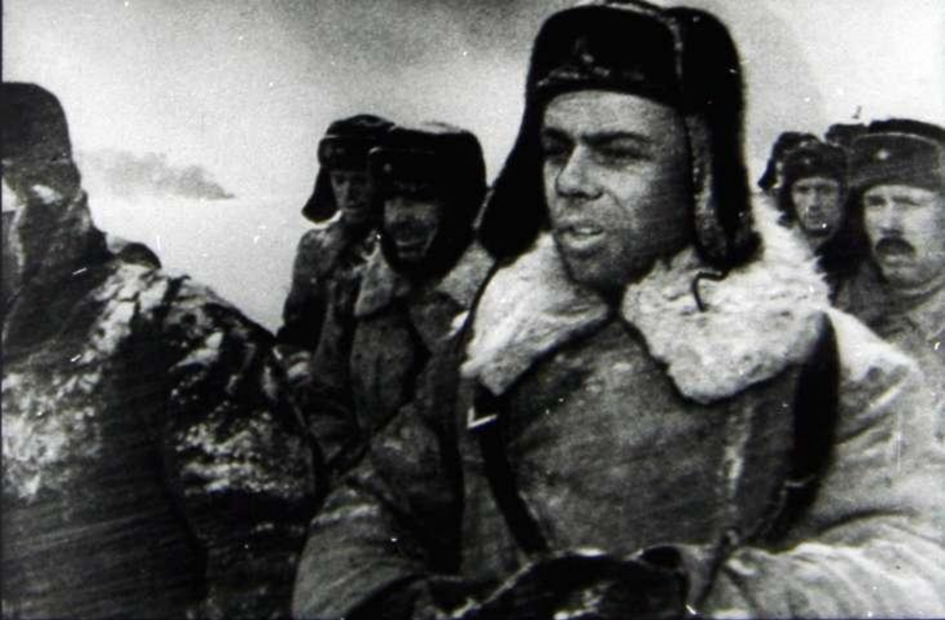
Батальон понес большие потери, люди безмерно устали, но на все были согласны, только бы больше не останавливаться, а гнать, гнать немцев все дальше от Москвы.