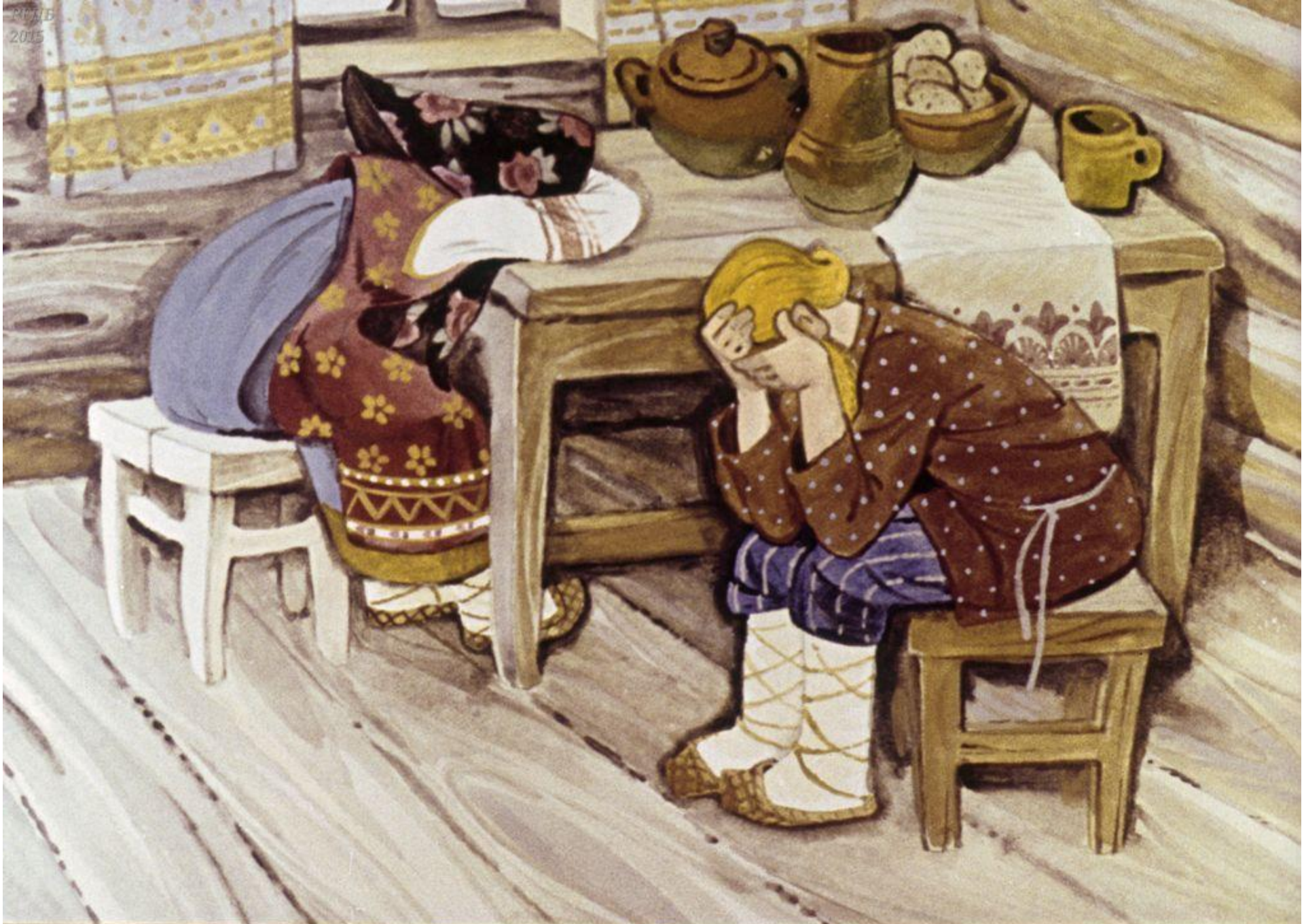
матушка плачет, батюшка плачет,