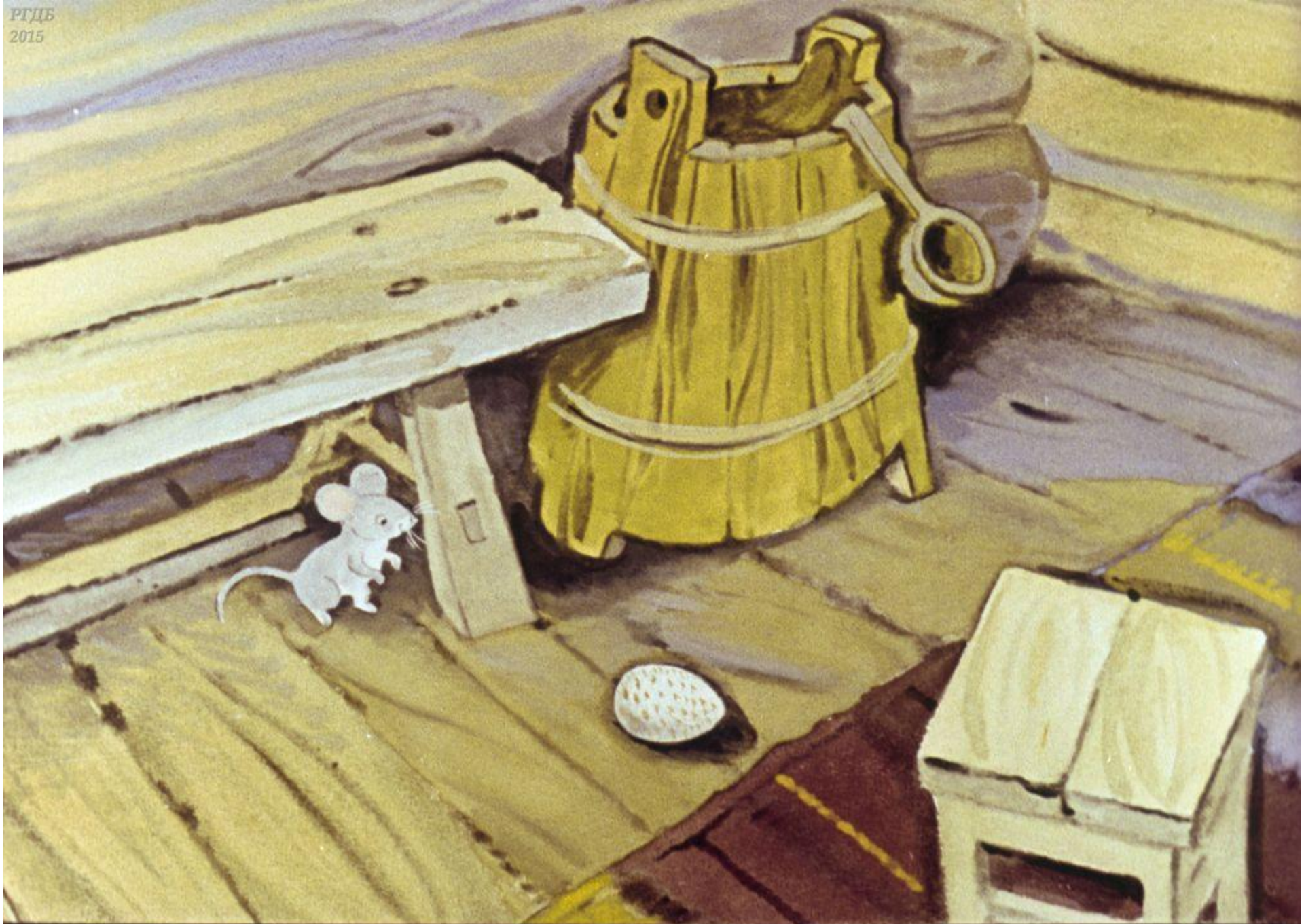
на сосновый пол.