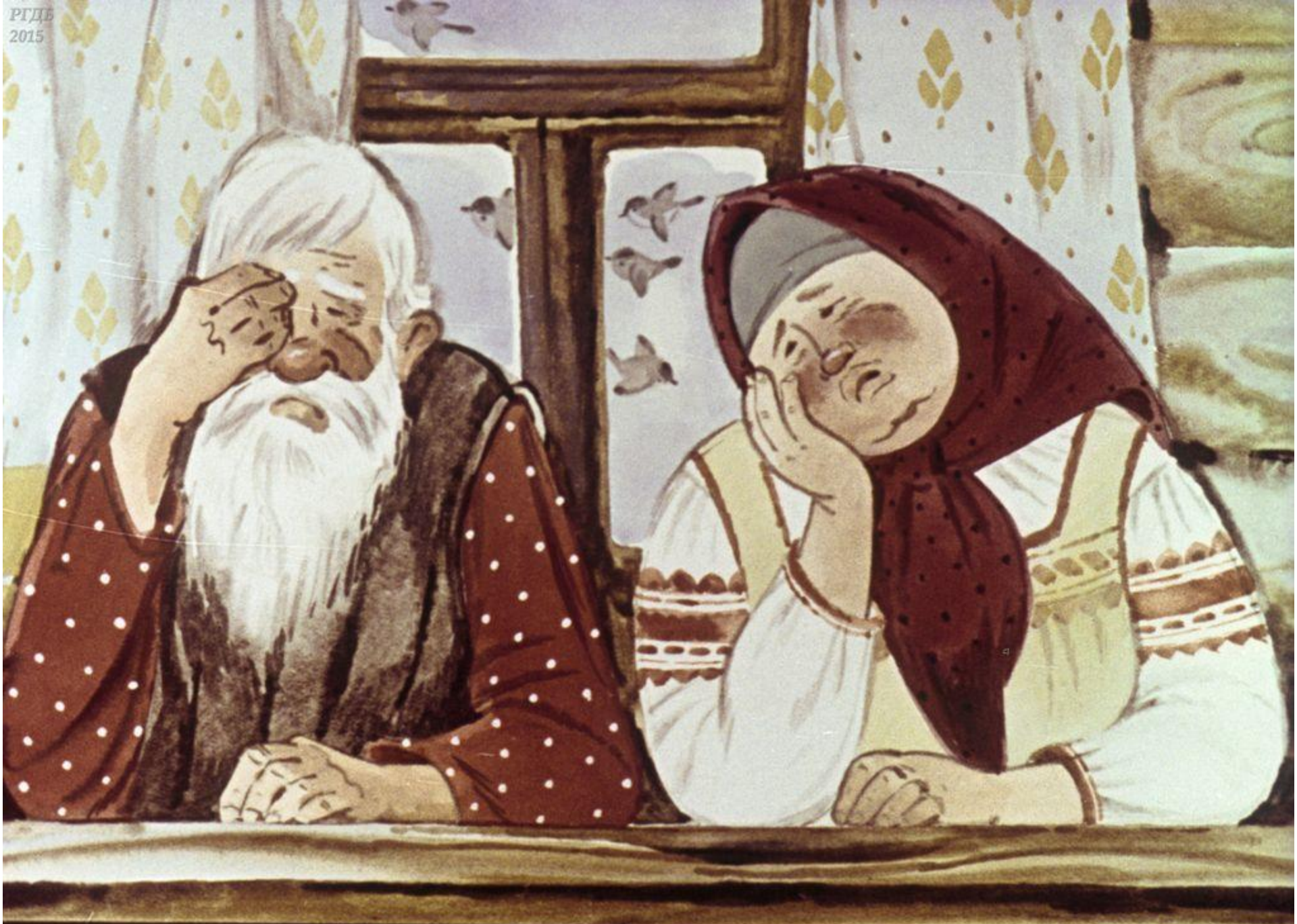
Дед плачет, баба плачет,