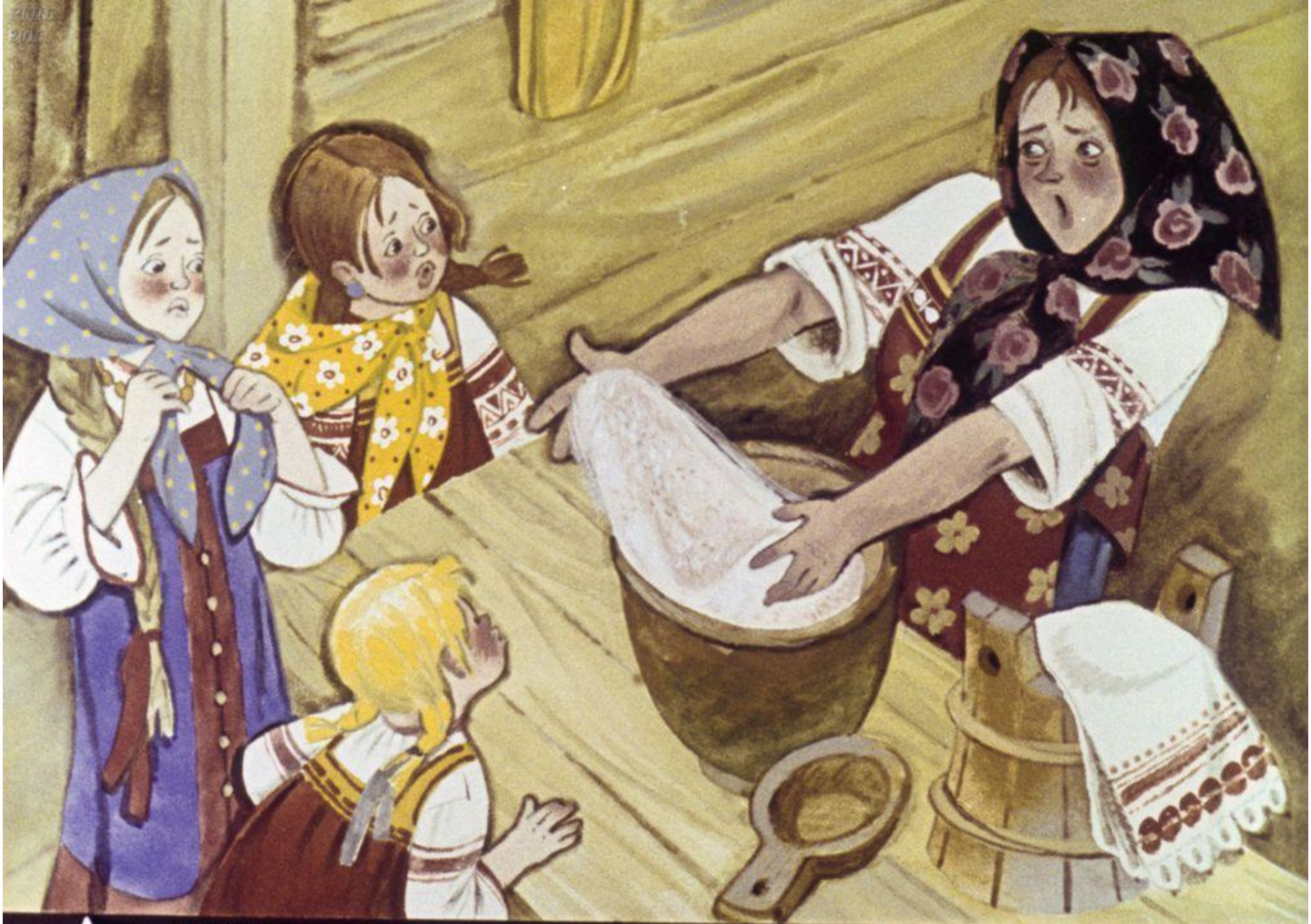
А матушка тесто месила. Как услышала — заголосила,