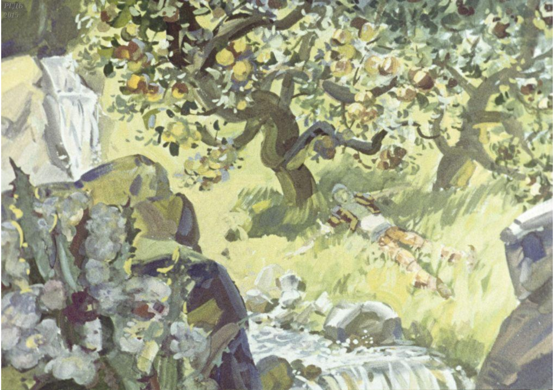
Набрал живой воды. Набрал и притомился. Спит Скороход, 27