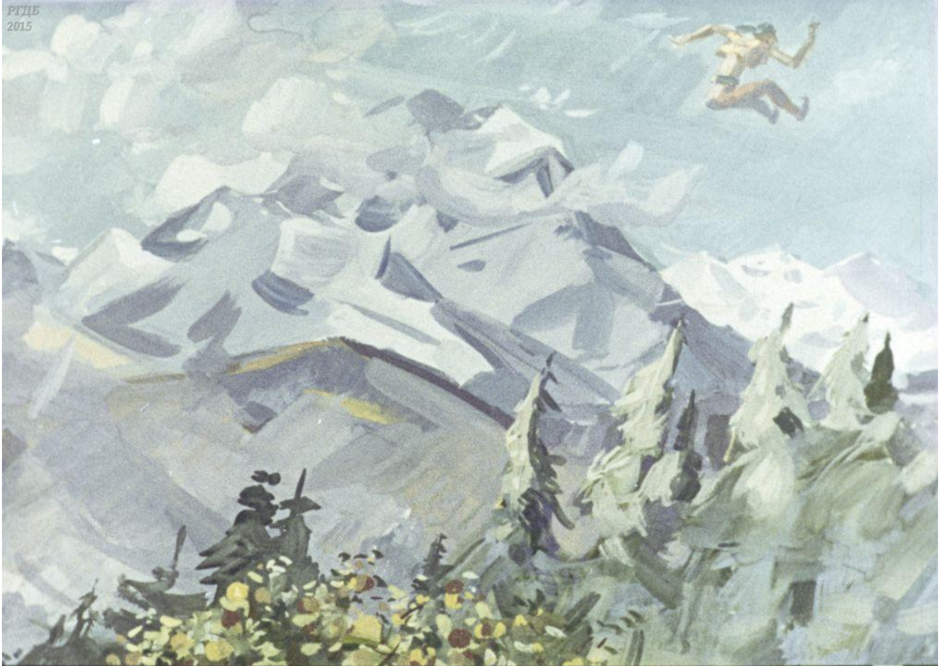
да как махнул, так в один миг на краю света очутился. 26