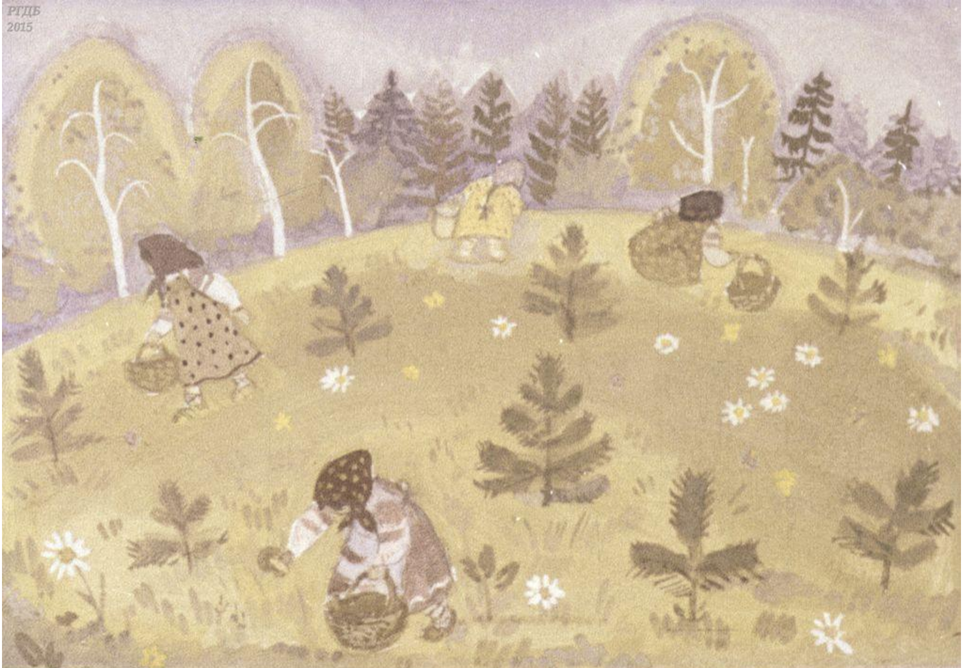
Пришли девочки в лес, стали собирать грибы да ягоды. 6