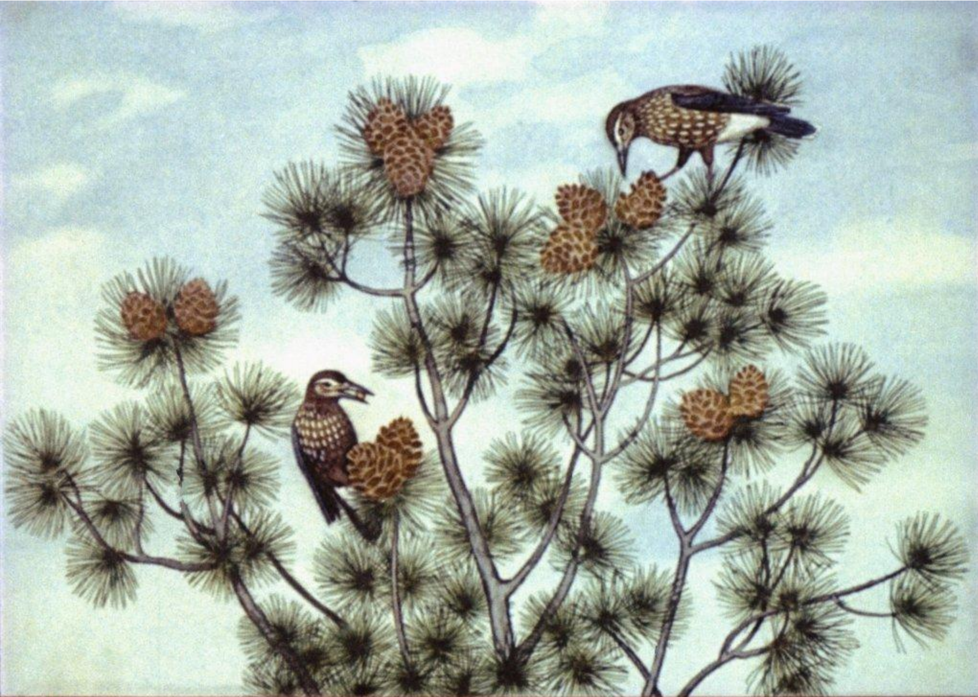
Кедровки с криком прыгают с ветки на ветку. Шелушат шишки. 16