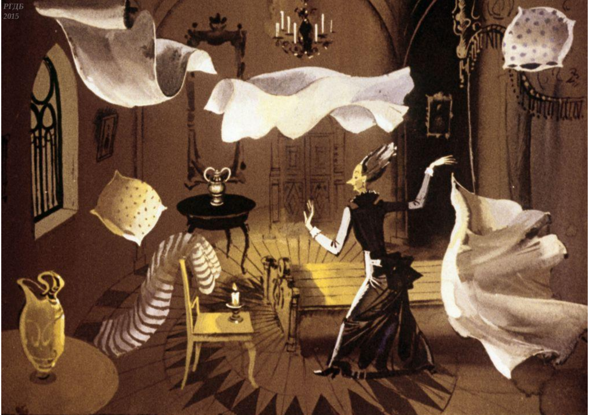
Там она сбросила с кровати одеяла и простыни...