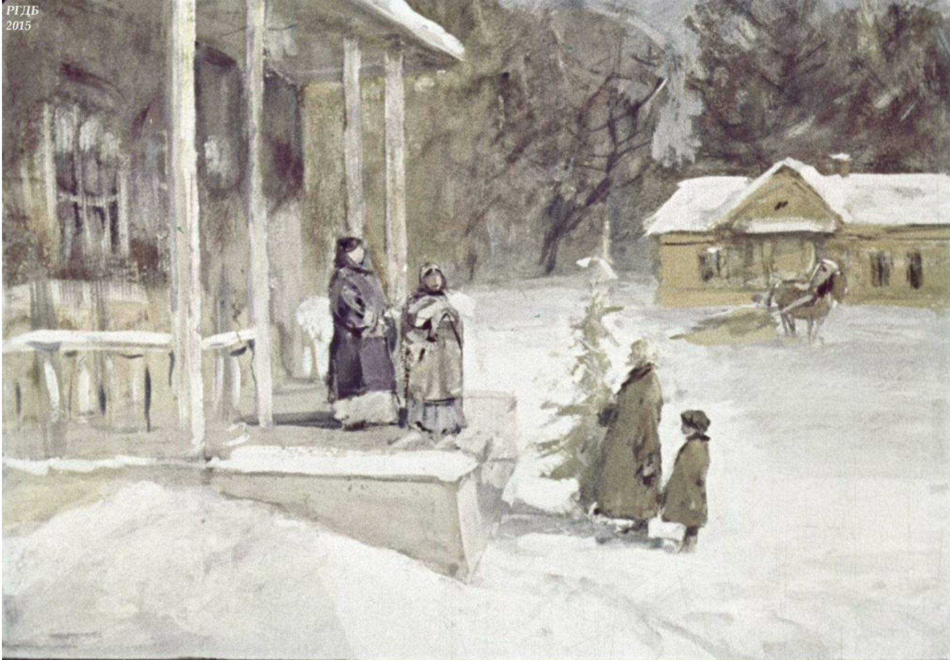
Срубленную ёлку дед тащил в господский дом,