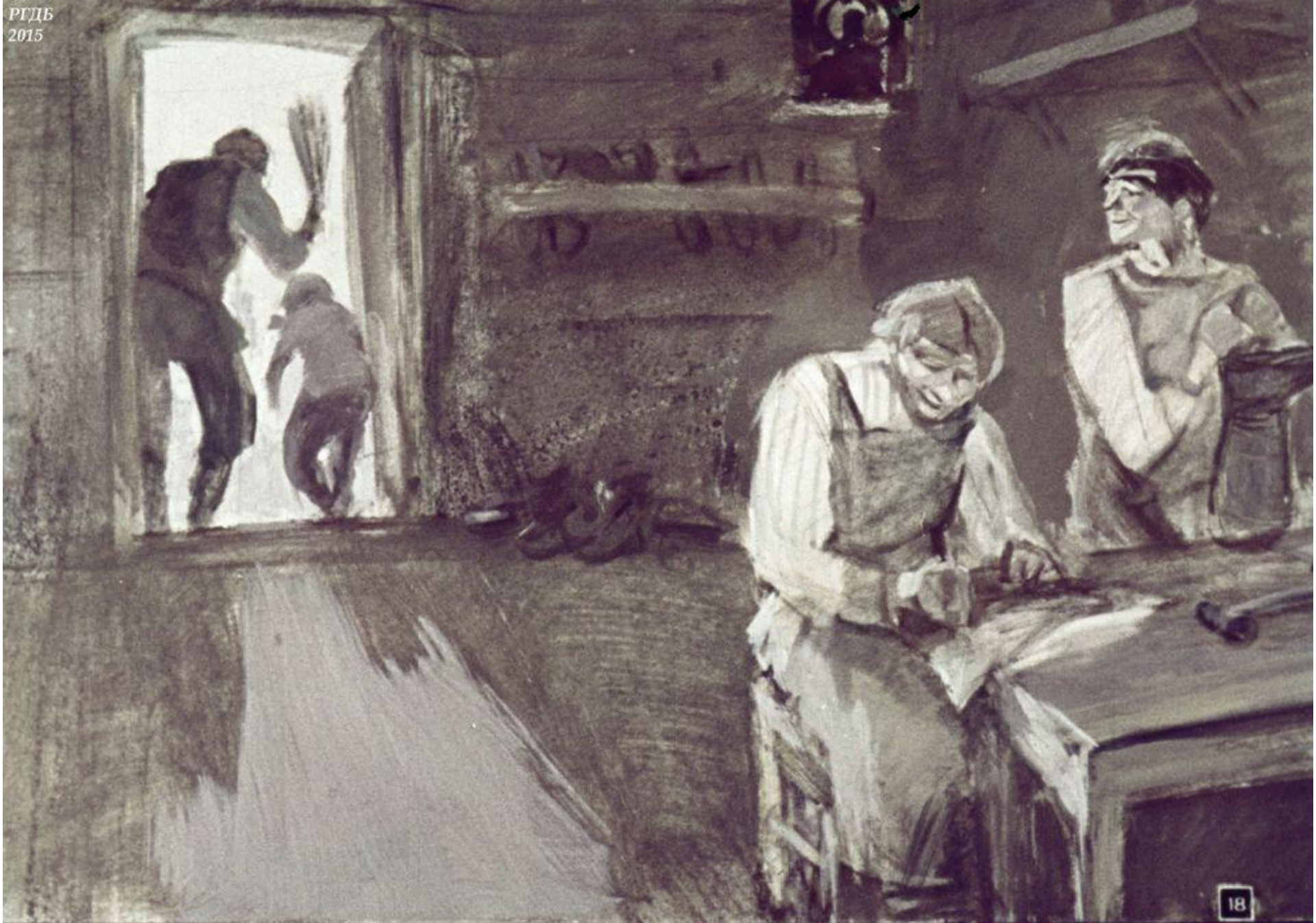
и велят красть у хозяев огурцы, а хозяин бьёт чем попадя.