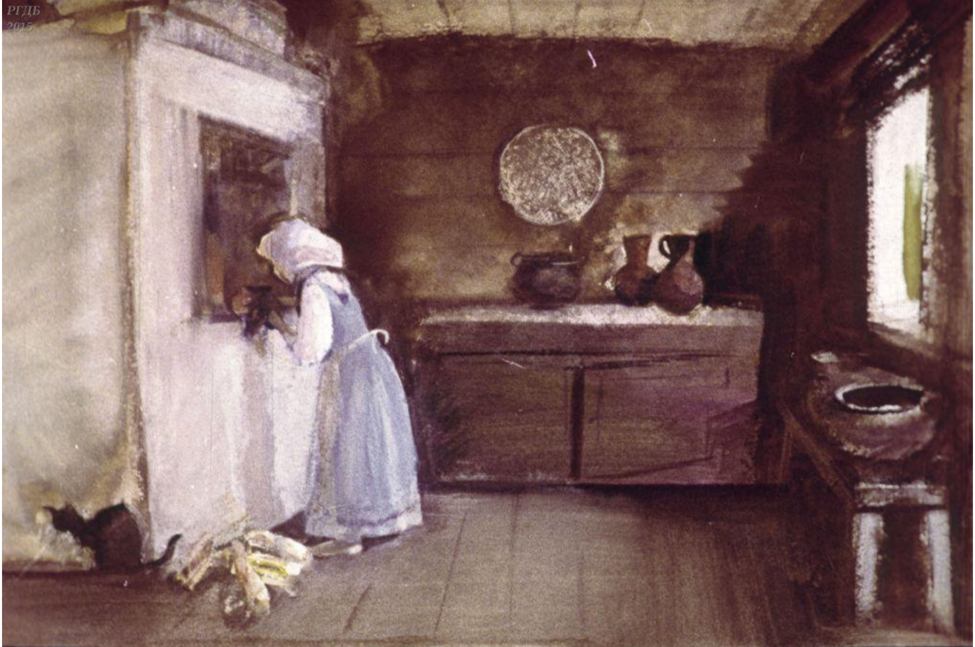
Ноюваня с утра на работу уходил, Дарёнка в избе прибира- ла, похлёбну да нашу варила, а кошка Мурёнка мышей ловила.