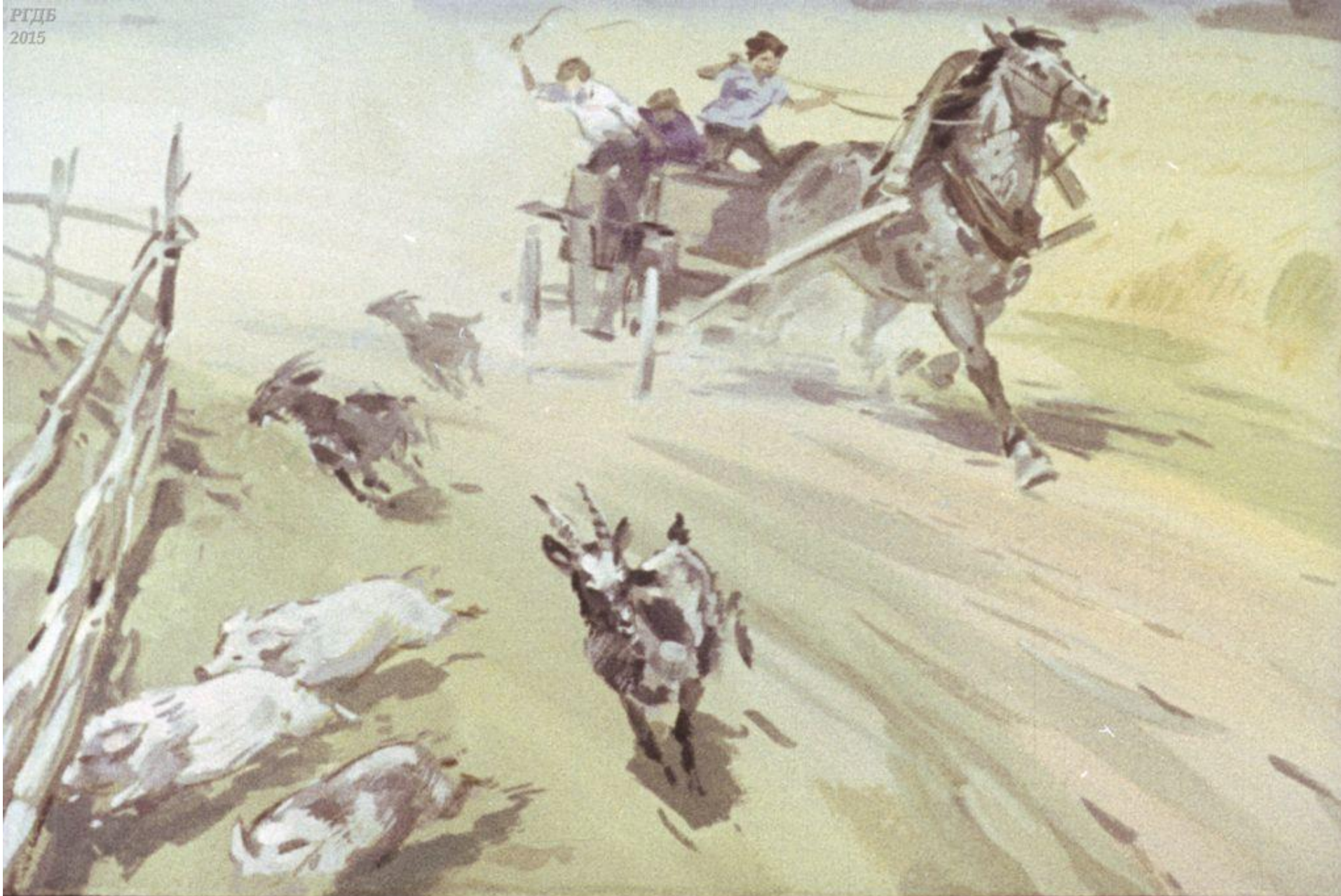
Одна из тачанок тем временем носилась за околицей: выгоняла с колхозного поля коз и поросят.