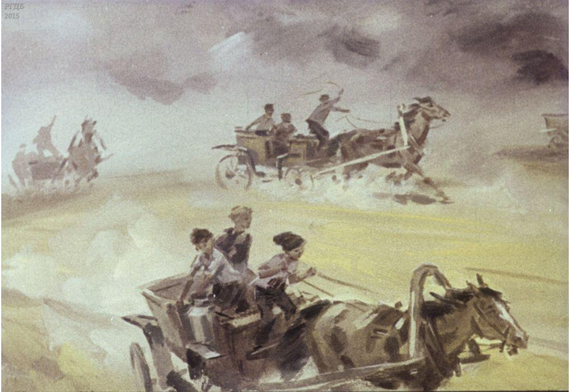
Тачанкам приходилось снова и снова подвозить воду с реки. 25