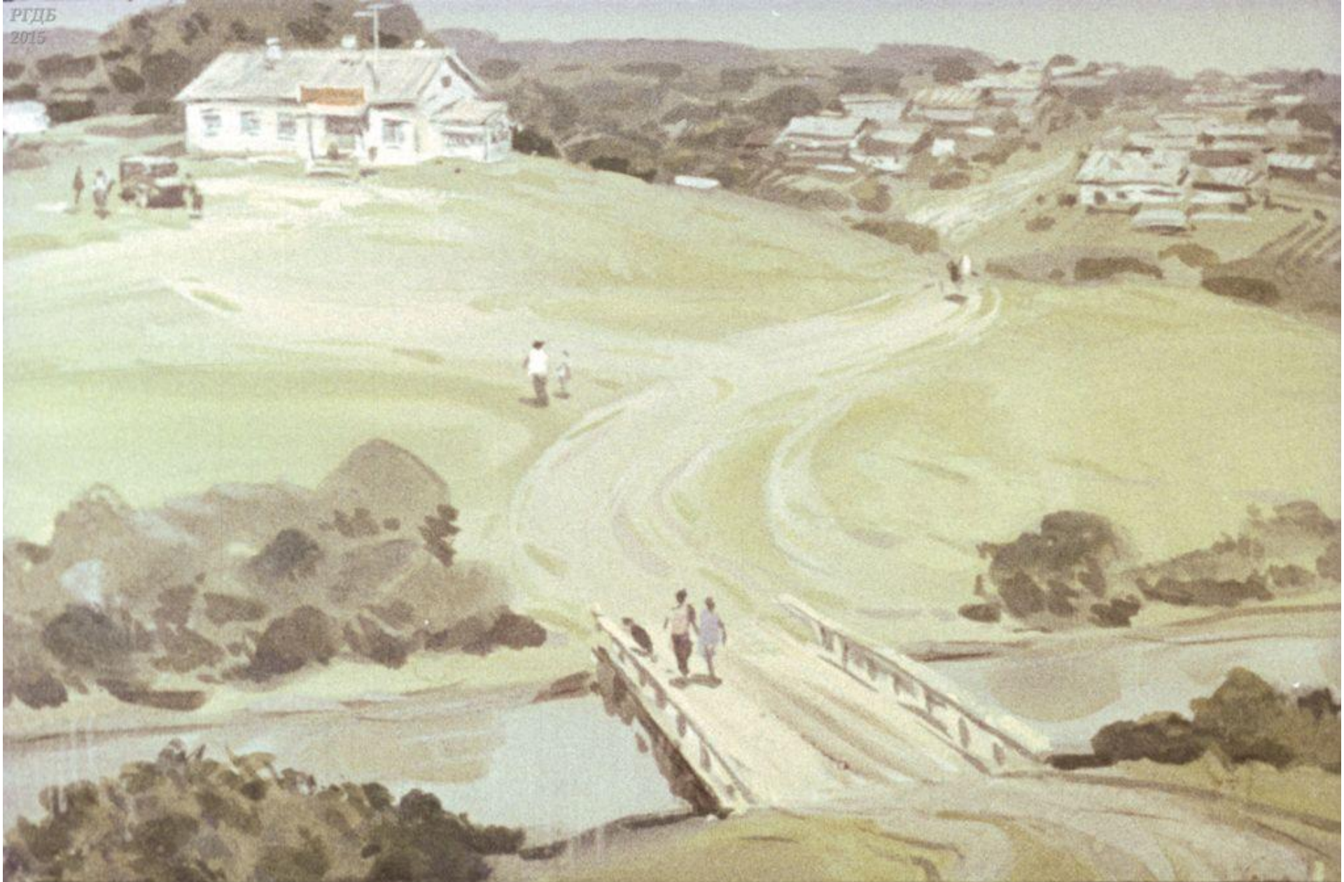
Пересекли степь. Впереди, за речкой, родное село, на бугре—правление колхоза.