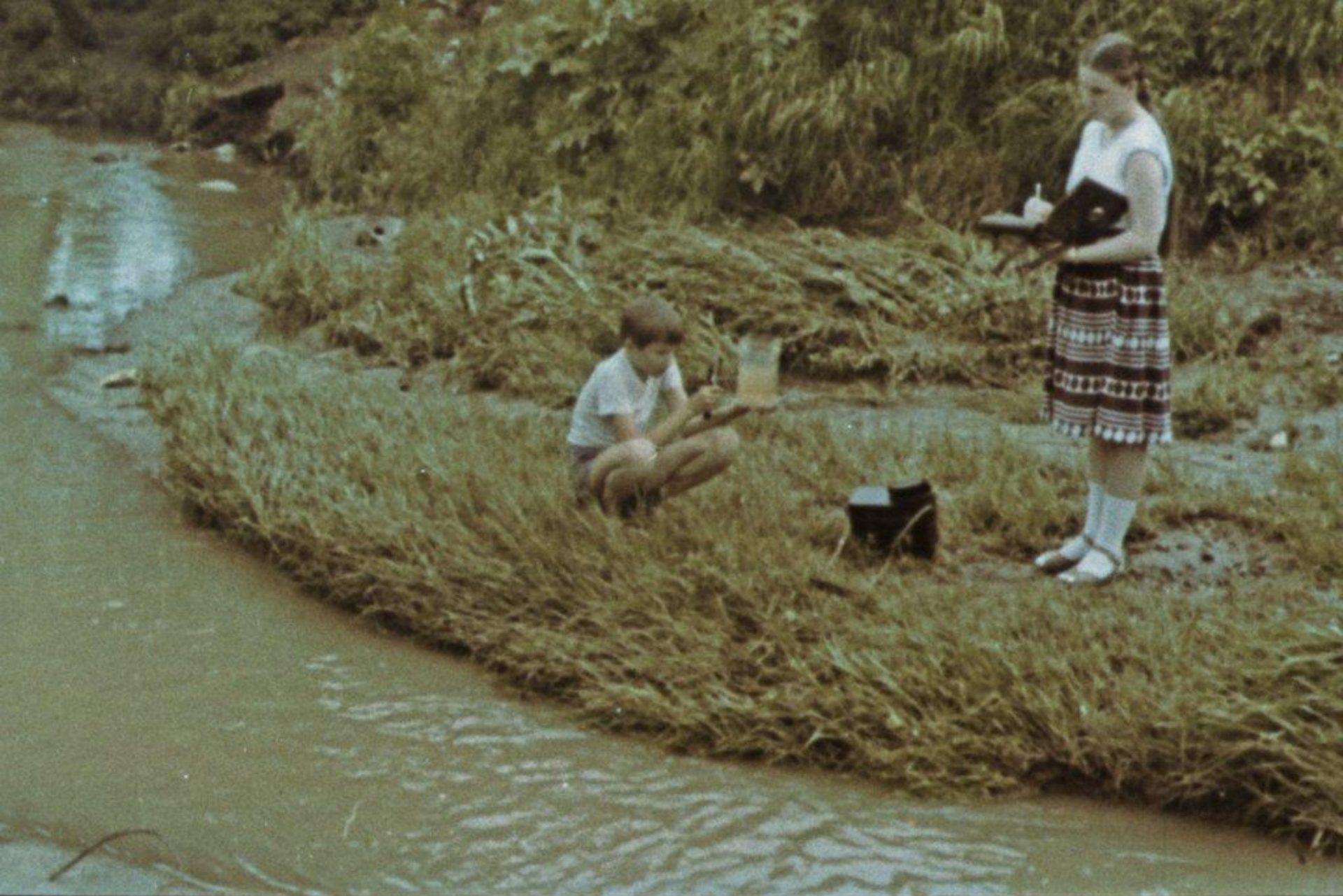
Школьники Москвы, пройдя походами вдоль многих малых рек Подмосковья, выявили источники их загрязнения.